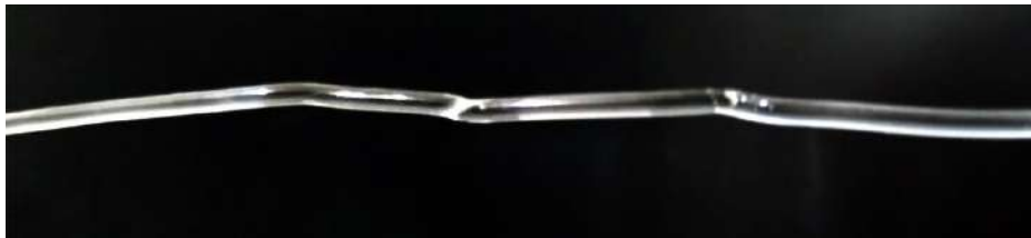
شكل (٧) يوضح عدم انتظام سمك خيوط البلاستيك

ب- استخدام جهاز طارد للإنتاج الكمي في انتاج خيوط الطباعة ثلاثية الابعاد تم استخدام جهاز طارد أحادي البرغي (اللولب) صيني الصنع من شركة (Suzhou ACC Machine) موديل FLD-45A ، يتميز هذا الطارد بقدرة إنتاجية عالية وأداء إنتاج مستقر للغاية ودقة عالية وضوضاء منخفضة. والشكل (٨) يوضح