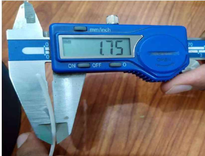
شكل (٩) يوضح سُمك الخيوط باستخدام القدمة ذات الورنية

- تم قياس سُمك الخيوط المنتجة عدة مرات وخلال جميع التجارب باستخدام القدمة ذات الورنية (Vernier caliper) وكانت النتيجة ١,٧٥ مم كما موضح بالشكل (٩).