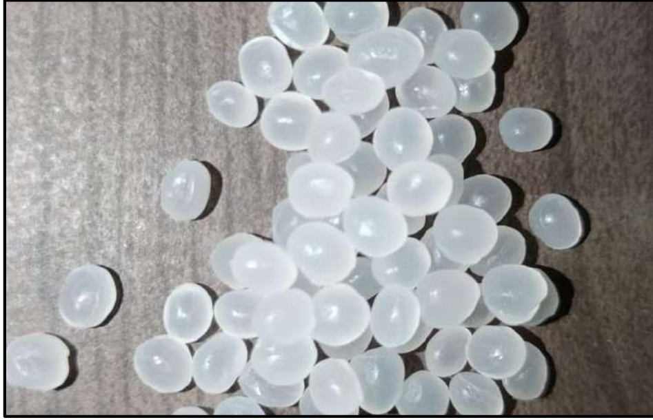
شكل ( ١ ) يوضح حبيبات متعدد حمض اللاكتيك

- تم توفير مادة متعدد حمض اللاكتيك علي شكل حبيبات من أحد الشركات استيراد المواد الكيميائية والبلاستيكية، وكانت كثافته ١,٢٥ جرام لكل سنتيمتر مكعب والشكل (١) يوضح شكل الحبيبات.