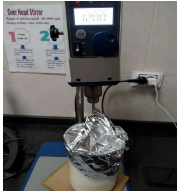
شكل (٥) يوضح جهاز الخلط الكهربائي Electric Overhead Stirrer

- ينتج عن هذه السرعة توزيع جيد لمسحوق ثاني أكسيد السيليكا النانوية في حبيبات متعدد حمض اللاكتيك، ولكن لكي يبقي المسحوق موزع بشكل متساوي عند إدخاله في الطارد Extruder لابد من إضافة زيت البرافين بنسبة قليلة لا تتعدى ال ٢% من وزن مادة متعدد حمض اللاكتيك. ثم تم رفع درجة الحرارة الي ١٢٥ درجة سليزية، وسرعة ٨٠٠ ل/د لمدة ٤ دقائق، حيث كان الهدف منها توزيع الزيت علي كامل الكمية وبالتساوي بالإضافة الي انه عند درجة حرارة ١٢٥ سليزية يحدث