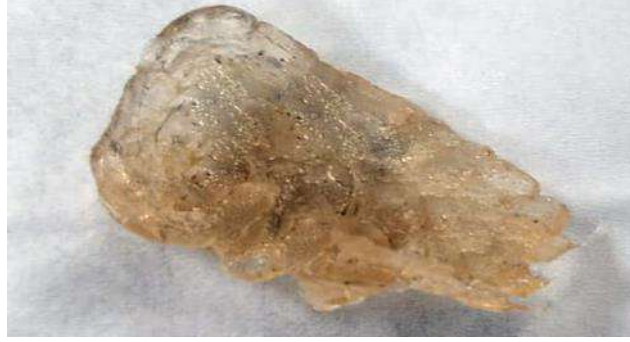
شكل (٤) يوضح تشتت المواد متجانس بعد إضافة زيت البرافين لهم

وعلي هذا تم البدء في التجارب الفعلية بالنسب المطلوبة لإنتاج الخيوط عن طريق جهاز الطارد، حيث تم عمل تجربتين، كان لكل تجربة نسبة مختلفة من النانو سيليكيا كالتالي (١%، ٢%) بالإضافة الي تجربة ثالثة تحتوي علي مادة متعدد حمض اللاكتيك بدون مواد نانو كما يلي: