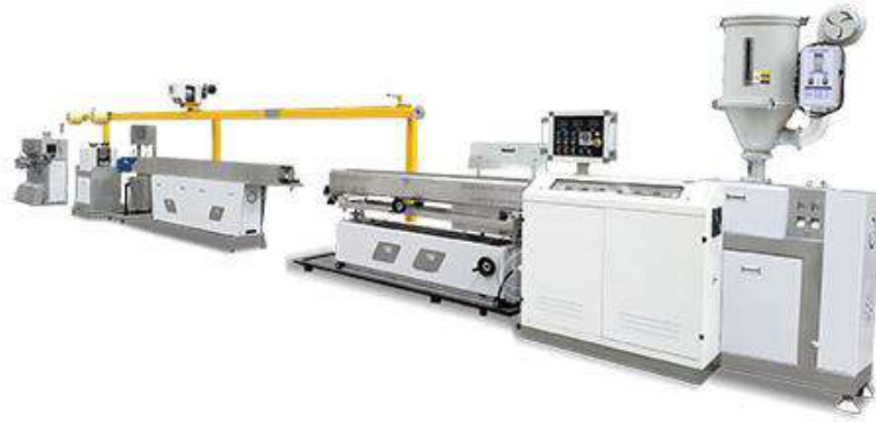
شكل (٨) يوضح الطارد (FLD-45A) المستخدم في التجارب

الطارد المستخدم، حيث يحتوي هذا الطارد على أربع مناطق للتسخين، كما يوجد به نظام مراقبة لمتابعة جودة وسمك الخيوط أثناء عملية الإنتاج.