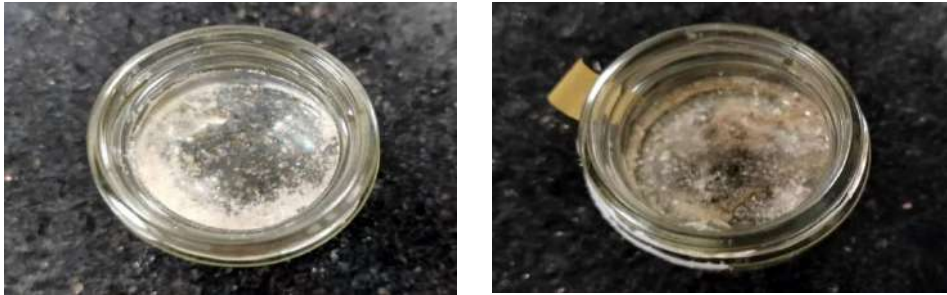
شكل (٣) يوضح العينتان بعض انصهارهم في الفرن

- تم تحضير عينتين بتركيزات مختلفة من مادة ثاني أكسيد السيليكا النانوية ومتعدد حمض اللاكتيك لمعرفة درجة تشتت المادة الأولي في المادة الثانية (خاصة ان المادة الأولي عبارة عن مسحوق أما المادة الثانية عبارة عن حبيبات) وذلك عن طريق خلط المادتين ووضعهم في فرن معلمي (laboratory oven (memmert) عند درجة حرارة ١٧٠ سيليزية وعينة اخري عند ١٨٠ سيليزية ولمدة ١٠ دقائق بهدف انصهارهم. - بعد اخراج العينتان اتضح من خلال النظر ان مسحوق ثاني أكسيد السيليكا النانوية لم يتوزع بشكل متساوي علي حبيبات ومتعدد حمض اللاكتيك والشكل (٣) يوضح ذلك.