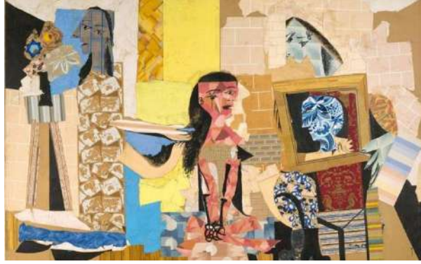
شكل (١) استخدم بيكاسو قصاصات من ورق الجدران لعمل لوحة نساء في غرفة الزينة خلال عامي ١٩٣٧، ١٩٣٨

البدايات التي ألهمت بيكاسو الانتقال إلى مستوى جديد، فخلال تلك المرحلة استخدم بيكاسو مواد مثل ورق الجدران المزخرف والإعلانات وقطع القماش والمؤثرات البصرية، وعلى الرغم من إدخال مواد غير مألوفة في أعماله فإن جودة العمل مازالت موجودة، وقد دمجت هذه المواد تماماً في أسلوب ومنطق التركيب الخاص به، هذه الطريقة كانت تُقرأ كنظام إنتاج للإشارات والرموز على أنه مستوى جديد من التأثير، فقد استعمل طريقة الكولاج ولكن بأعمال ثلاثية البعد وذلك عن طريق تركيب المواد المتنوعة التي استخدمها وبنائها.