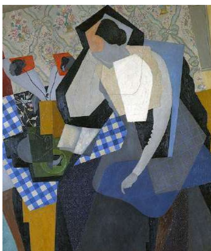
شكل (٤) أحد لوحات الفنان جينو سيفيريني

هي أول حركة فنية في العصر الحديث يُدرك أهميتها نتيجة تأثير الآلات الحديثة والإختراعات التكنولوجية وإهتمت بالجانب الفلسفي بالإضافة إلى جانب الجمال في أعمالها وحاولوا إظهار الجانب الفلسفي وكذلك قامو بتأكيد عنصر الذهن، وإهتمت هذه المدرسة بالسرعة والديناميكية والحركة والتلقائية؛ فقد قام الفنان جينو سيفيريني Gino Severini بتقديم لوحات عديدة من خلال المستقبلية والكولاج إستخدم فيها قصاصات من الجرائد والمجلات، وتأثرت المستقبلية بالكولاج حيث تحررت من تقاليد التكوين التي كانت تشكل وتحكم الحروف والكلمات واستخدمت الألوان والخطوط والأشكال والخامات المختلفة، وتأثروا بالكولاج التكعيبي وكان جينو سيفيريني رائداً من رواد المستقبلية وتعرف على أعمال التكعيبيين في الكولاج وأنتج لوحات للطبيعة الصامتة أقرب للتكعيبية في أسلوبها باستخدام الكولاج كما استخدم في لوحاته حروف الكتابة والأوراق المتناثرة وقصها ولصقها فهو استخدم الكثير من الخامات المتنوعة في أعماله.