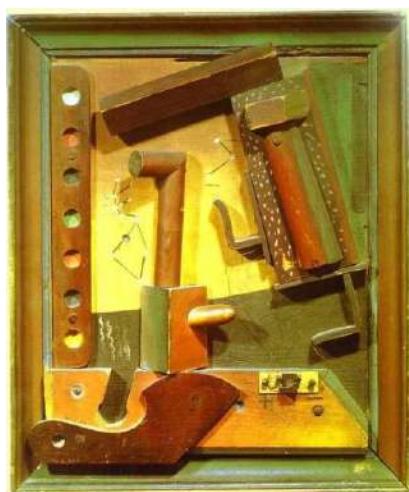
شكل (٣) لوحة للفنان ماكس إرنست بالكولاج من مجموعة من الأخشاب

هي حركة سيكولوجية تلقائية هدفها التعبير عن الطريقة الحقيقية للأفكار متحررة من قيود العقل الواعي والتقاليد المألوفة، فتم استخدام ورق المجلات القديمة وقص ما فيها من صور ولصقتها لتكون أشكال فنية من عناصر متنوعة، وقد تميزت السيريالية بعنصر المفاجأة، فالسيريالية تبنت الخيال وإتاحة الفرصة لتجريب خامات عديدة واتبعوا أسلوب التوليف لتلك الخامات بالإضافة إلى المعالجة اللونية في إطار غير تقليدي وتم إعتبار الكولاج أهم عامل محفز للسيريالية، ويعتبر ماكس إرنست من أبرز المصورين الذين طوروا أسلوب الكولاج حيث قام بتوظيف مجموعة من الخامات الطبيعية والمصنوعة في صياغات جديدة.