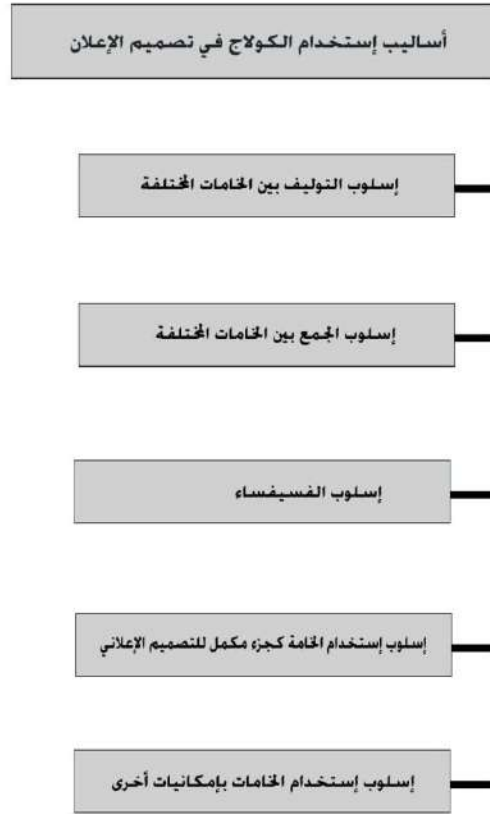
شكل(٩) يوضح أساليب استخدام الكولاج في تصميم الإعلان

أساليب استخدام الكولاج في تصميم الإعلان: