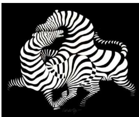
شكل(٧) لوحة Zebra للفنان فيكتور فازاريللي

هو حركة فنية ظهرت في منتصف القرن العشرين ويتحقق فيه الخداع البصري عن طريق تحوير الأشكال والألوان بشكل منتظم وبخطوط دقيقة فهذا التأثير يتم عن طريق التلاعب بالخطوط أو بالألوان مع استخدام الأسلوب الهندسي بطريقة تهدف إلى التلاعب بالأشكال وعلاقاتها معاً لتبعث إحساس بالغموض والتناقض لدى المتلقي ،ومن سمات الفن البصري ذلك أنه إتخذ طابعاً تجريدياً هندسياً مما ساعد في خلق الخداع البصري الحركي ،واهتم أيضاً بالدراسات المرتبطة باللون والحركة والضوء وقواعد المنظور كذلك اهتم بالعلوم المرتبطة بالإدراك الحسي والرؤية البصرية فهو يتسم بالديناميكية والإيهام بالعمق والحركة مما كان له دور في دمج الكولاج بالفن البصري من خلال إستخدام قصاصات الورق وتقطيعها بشكل هندسي وخلق نوع من الخداع والإيهام بالحركة أو البعد الثالث.