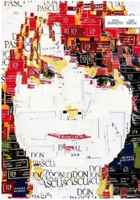
شكل (١٠) يوضح أسلوب الفسيفساء في تصميم الإعلان بالكولاج

رابعاً: أسلوب استخدام الخامة كخلفية أو مكملة: