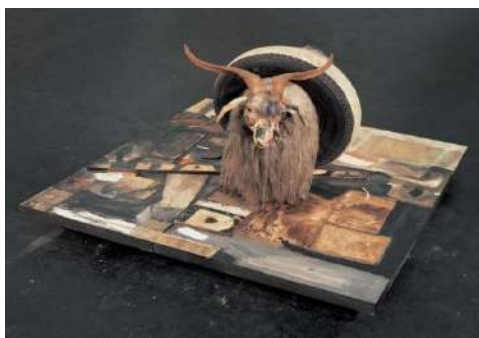
شكل (٦) روبرت روشنبرج (monogram) دمج الرسم والنحت مع انتقال المجموعة من الجدار إلى القاعدة

هو فن الحشد والتركيب وذلك لإثارة الشعور باللمس والإحساس بالمتعة البصرية، فهم أخذوا عناصرهم مما تقع عليه أعين الناس في حياتهم اليومية ووضعها أمامهم لتأكيد المعنى فلجأوا إلى استخدام الكولاج في أعمالهم وامتازوا بالإفراط في التجريد، وعبر فنانون البوب عن مظاهر حياتهم الحديثة باستخدام فن الكولاج من خلال تجميعهم للصور الفوتوغرافية والخامات المختلفة المباشرة وغير المباشرة وقاموا بتحقيق البعد الثالث في أعمالهم من خلال تنوع الخامات وطرق تركيبها مع بعضها البعض، وبظهور البوب آرت فجر الإمكانات الواسعة لفن الكولاج وساعد على تنمية الحس الجمالي إذ يمكن للفنان استخدام خامات متعددة غير تقليدية متوفرة في البيئة تجعله قادراً على تناول أشياء لا قيمة لها فتبدو قيمة ويجعلها مصدر للإحساس بالجمال والتعبير، ومن أهم الفنانين الأمريكيين المؤثرين في حركة البوب آرت هو روبرت روشنبرج وقد استخدم في أعمال الكولاج أشياء مستمدة من الواقع المحسوس فجمع بين السطح الملون ثنائي الأبعاد والأشياء ثلاثية الأبعاد والتعامل معها من خلال التجميع، فقد تعامل الفنان مع الخصائص البصرية للمواد ويعكس مشاعر الرهبة واهتم بإثارة المشاعر الإنسانية إتجاه الأشياء من خلال تضخيمها عن الأحجام المتعارفة مؤكداً بأن العمل الفني يبدو أكثر واقعية فهو يقوم بالمزج بين المضمون الواقعي والشكل الفني .