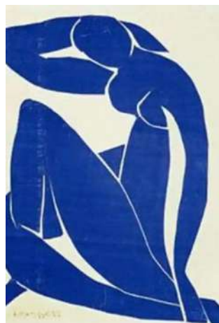
شكل (٥) لوحة بالكولاج لهنري ماتيس ١٩٥٢ تتكون من ورق مقصوص ملصق على قماش

كان على التجريدية التعايش مع التجارب الحديثة، والكولاج كان النتيجة الطبيعية لمباشرة الإحساس الذي ينتمي إلى الخبرة والتجربة ليقدّم فن لا موضوعي يسعى إلى اللاشكل بدلاً مما كان متبعاً وتقليدياً، فاندماج القصاصات مع نسيج اللوحات والتصميم في التجريدية يؤكد على وحدة العمل ويلعب دور في إدراك وفهم كولاج التجريدية في إثارة القدرة الذهنية على حدى اللاوعي والوعي عند رؤية العمل الفني وإغراق المتلقي داخل عمق العمل الفني الديناميكي بأدائه الخيالي.