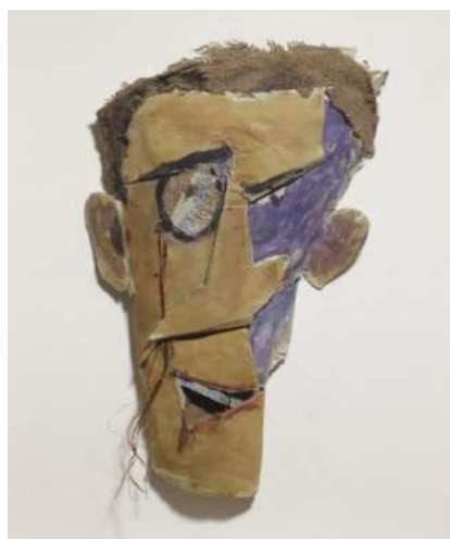
شكل (٨) لوحة بعنوان "approximate man" للفنان مارسيل يانكو عام ١٩١٩ يظهر فيها استخدامه لخامات كولاج مختلفة ساهمت في خلق البعد الثالث

يميل هذا النوع من الفن بشكل كبير إلى التجريد ومحاولة عزل كل ما هو خارجي ودخيل واعتمد في خاماته على الزجاج والخشب وماشابهه وكان يعتمد على أسلوب الإختزال والغرابة والحدة والإبتكارية البصرية للأشكال المجسمة ،ويسهم الكولاج في التصوير ثلاثي الأبعاد من خلال توزيع الصور والقصاصات وخامات عديدة كالخشب والزجاج وغيرها مما يستخدم في فن المينيمال حتى نصل إلى عمل يجنب الإنتباه من خلال الإبتكارية البصرية للأشكال المجسمة ،ويعد مارسيل يانكو من رواد هذا الفن وقد حقق التنوع في الملامس من خلال أعماله الفنية التي اعتمدت على الكولاج بإسلوب ساخر من خامات مختلفة قام بجمعها.