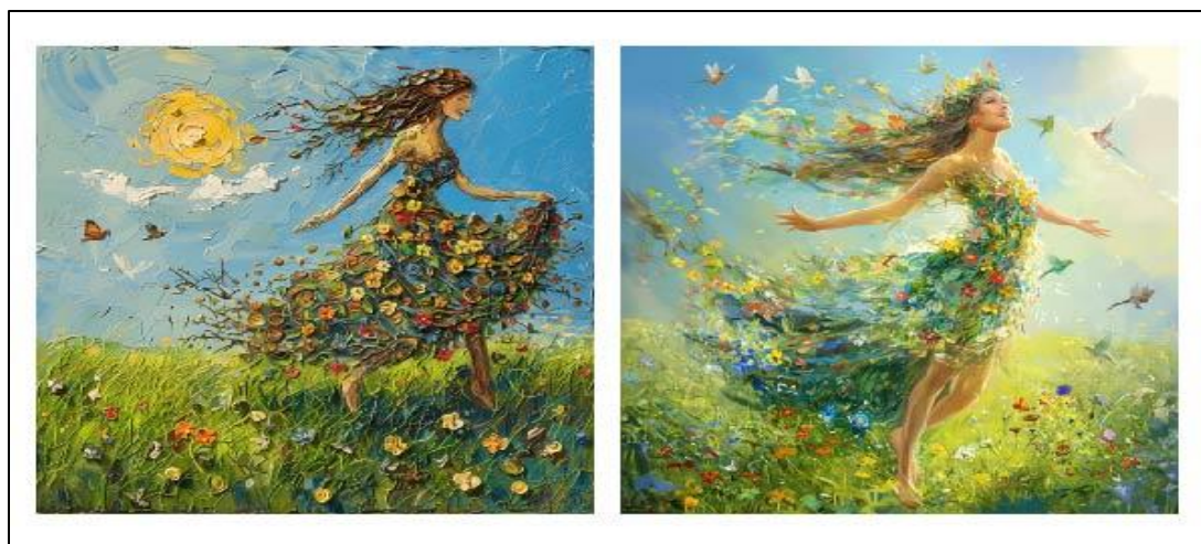
الشكل رقم (٦) يوضح نتيجة تحويل السرد الشعري في قصيدة الربيع إلى سرد بصري بواسطة موقع Midjourney