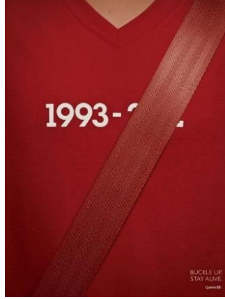
الشكل رقم (4) يوضح السرد البصري في صناعة صورة لإعلان توعوي بدور حزام الأمان في إنقاذ الحياة (Bashooka: Pinterest)

يقول جان ديفيد مورفان - وهو فنان فرنسي متخصص في القصص المصورة وحاصل على عدة جوائز في هذا المجال وصاحب فكرة نشر السير الذاتية للمصورين الصحفيين من القرن الماضي يتناول فيها أعمالهم - يقول: "الصورة الفوتوغرافية هي أيضاً سرد" (الحاج، ٢٠١٦، تاريخ الفوتوغرافيا الحديثة.. قصص مصورة). ويوضح الشكل رقم (3) صورة فوتوغرافية تسرد في لحظة خاطفة معاناة الأطفال من قبل عصابات متخصصة في استغلال واستعباد الأطفال لأغراض دنيئة في بنغلاديش.