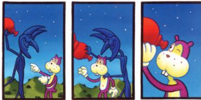
الشكل رقم (١) يوضح السرد البصري وصناعة الصورة للقصص المصورة (gjgreenberg)