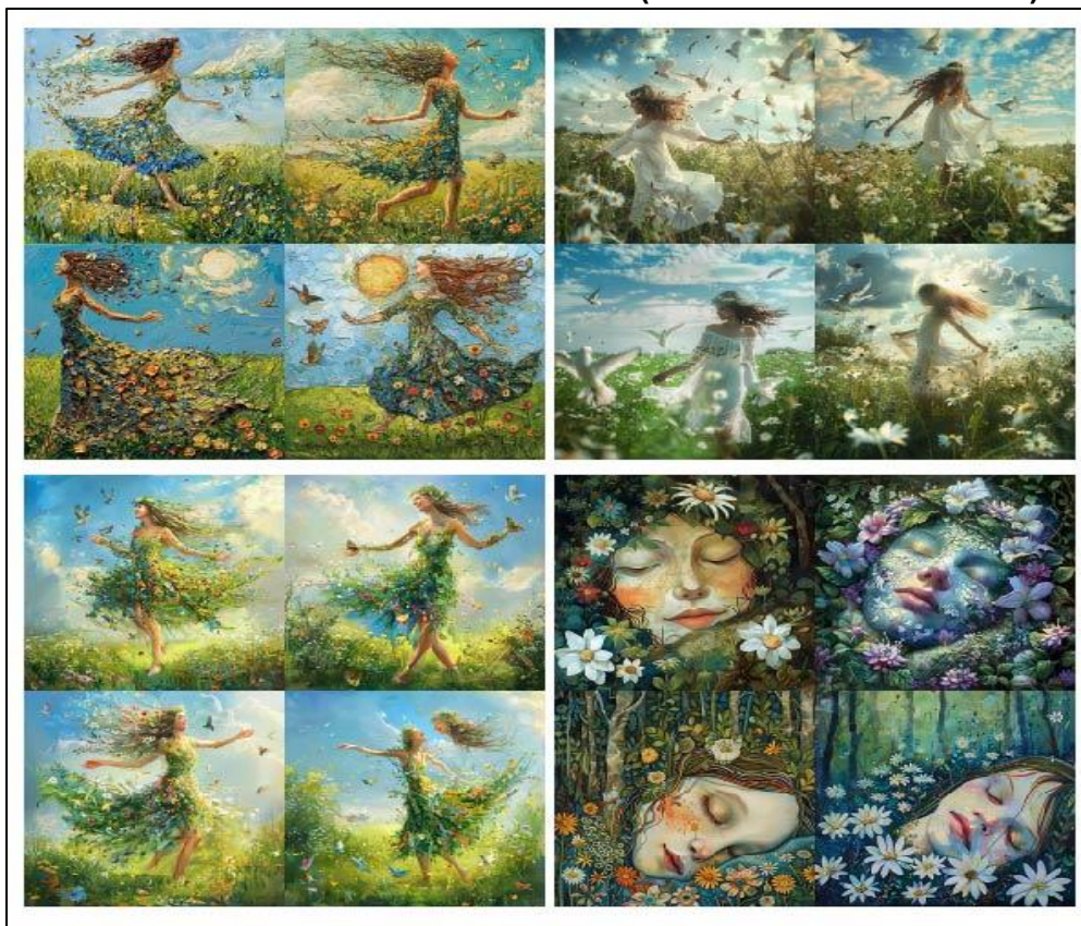
الشكل رقم (٥) عدد من المحاولات الأولية لتحويل الصورة الشعرية في قصيدة الربيع إلى صورة بصرية من خلال موقع Midjourney