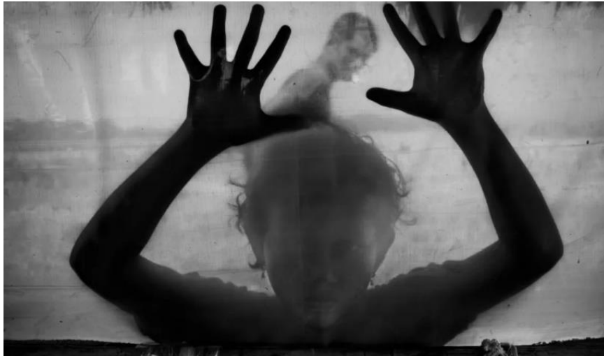
الشكل (3) يوضح السرد البصري في صناعة صورة تبرز مأساة استعباد الأطفال واستغلالهم

من قبل العصابات في بنغلاديش