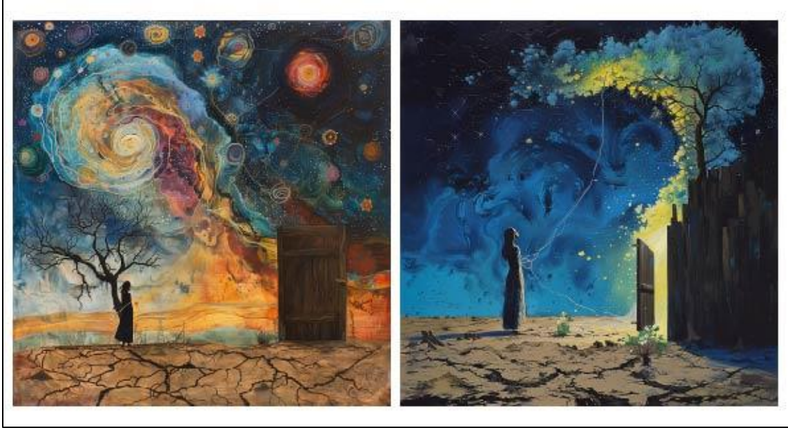
الشكل رقم (٧) يوضح النتيجة المتأتمية من تحويل السرد الشعري في قصيدة نحب الحياة إلى سرد بصري بواسطة Midjourney

ونسرق من دودة القز خيطاً لنبني سماءً لنا ونسج هذا الرحيلا ونفتح باب الحديقة كي يخرج الياسمين إلى الطرقات نهاراً جميلاً نحب الحياة إذا ما استطعنا إليها سبيلاً