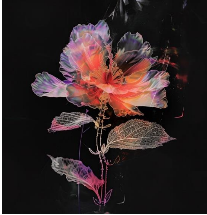
الشكل رقم (٩) يوضح تسرب الحياة من الوردة ببطء بعد قطعها