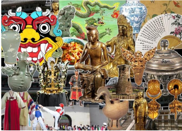
شكل 4 - يوضح - يوضح Mood Board من عمل الطلاب تعبر عن الثقافة الكورية القديمة

هذه المرحلة فيها نحدد ما نريده، ومن أين نحصل عليه، وكذلك كيفية الحصول على المعلومات المطلوبة بدقة، واستخدام المعلومات الموجودة كنقطة انطلاق، عن طريق جمع المعلومات وتصنيفها، لتوجيه المنتج بطريقة مستهدفة. في هذه المرحلة قام الطلاب بدراسة السمات الثقافية المصرية القديمة، وكذلك السمات الثقافية الكورية - بشكل متتابع - من حيث الميثولوجيا والتاريخ والحضارة، حيث تم تقسيمهم إلى مجموعات وكل مجموعة قامت بدراسة موضوع خاص بالميثولوجيا ثم القيام بعرض تقديمي عن هذا الموضوع حتى يتاح لجميع الطلاب التعرف على أكبر قدر من المعلومات بأقل وقت ممكن، ثم قاموا بشكل فردي بجمع الأيقونات المختلفة المستخدمة في هيكلة تصميم المنتجات التاريخية المختلفة سواء جداريات أو برديات أو منتجات أو مشغولات من الحلي، مع الحرص على معرفة ماهيتها ومعانيها المختلفة وأسباب رسمها على هذه الهيئة، وبعد جمع هذه الرموز قاموا بعمل Mood Board توضح كل ما تم تجميعه من قبل كل طالب.