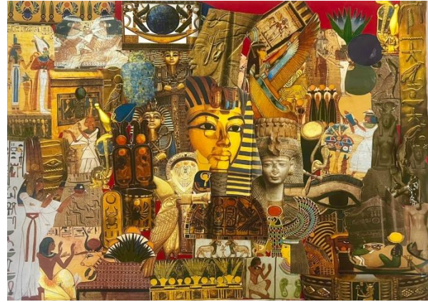
شكل 3 - يوضح Mood Board من عمل الطلاب تعبر عن الثقافة المصرية القديمة