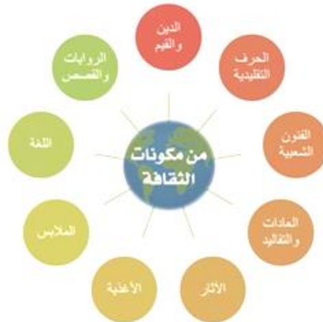
شكل 1 – يوضح أمثلة من مكونات الثقافة