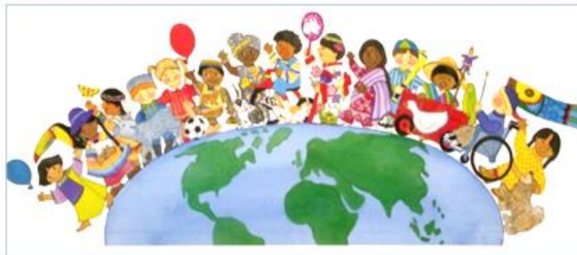
شكل 2 – يوضح مفهوم الخصوصية الثقافية للأفراد الممثلة لمجموعات بعينها (الهوية الثقافية)

الهوية الثقافية هي المعبر الأساسي عن الخصوصية التاريخية لمجموعة ما أو أمة ما، إضافة إلى نظرة هذه المجموعة أو الأمة إلى الكون والموت والحياة، إضافة إلى نظرتها للإنسان ومهامه وحدوده وقدراته، والمسموح له والممنوع عنه. إذا فإن الهوية الثقافية عبارة عن عدد من التراكمات الثقافية والمعرفية، سواء كانت تلك المعارف تأتي انطلاقاً من تقاليد وعادات في العائلة والمجتمع المحيط به، عاشها الفرد منذ لحظة ميلاده فكانت الأساس في تكوينه طيلة أيام حياته، وأصبحت جزءاً من طبيعته، أو انطلاقاً من الدين. الهوية الثقافية عبارة عن كيان يمكن أن يتطور، ولا يمكن تحديدها كمعنى نهائي؛ حيث إنها يمكن أن تسير في اتجاه الانكماش والتقلص أو باتجاه الانتشار، وتمتاز هذه الهوية بغناها الناتج عن تجارب أصحابها وكم المعاناة التي مروا بها ونجاحاتهم وانتصاراتهم وتطلعاتهم، إضافة إلى احتكاكها الإيجابي أو السلبي بالهويات الثقافية الأخرى التي تتداخل معها بشكل أو آخر.