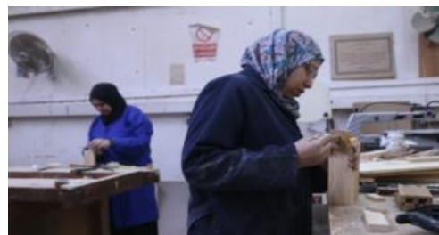
شكل (٩) اثناء رسم تعشيق النقر واللسان