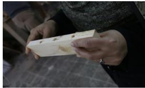
شكل (٧) المتدربة بعد الانتهاء من تنفيذ النقر