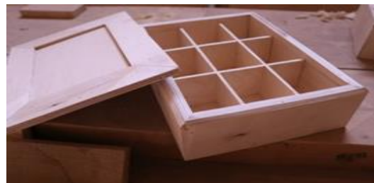
شكل (١٣) مكمل بسيط من الخشب "علبة مجوهرات"