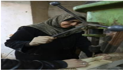
شكل (٦) متدربة مع ماكينة المنقار