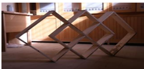
شكل (١٦) مكمل بسيط من الخشب "علبة المناديل"