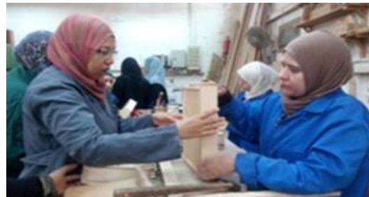
شكل (١١) بعض المتدربات تنفذ أحد المكملات البسيطة