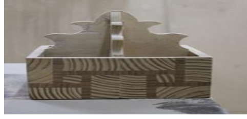
شكل (١٩) أحد المكملات قبل تنفيذ التفريغ الداخلي للقطع