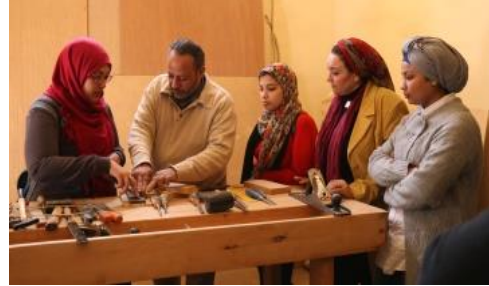
شكل (٣) بعض المتدربات مع المدرب والمسؤول الفني