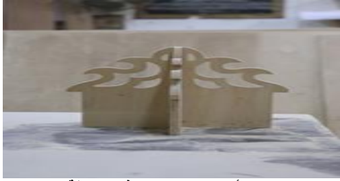
شكل (١٨) أحد المكملات المنفذة بصياغة التفريغ