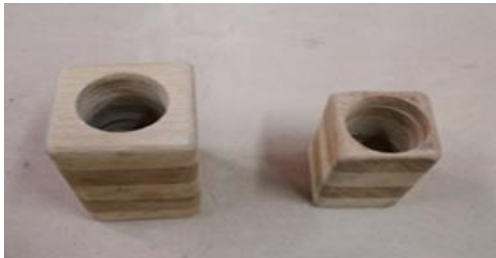
شكل (٢٤) مسقط أفقي لمقلمة بصياغة التفريغ والتدوير