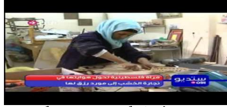
شكل (١) سيدة فلسطينية أثناء عملها بورشة النجارة https://www.alaraby.co.uk