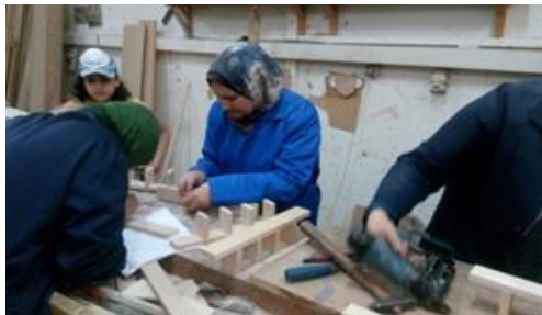
شكل (١٢) بعض المتدربات اثناء تنفيذ المكملات الخشبية

قد كانت الخطوة الأولى من المرحلة الثانية البداية العملية لتدريب المرأة في ورشة النجارة لمدة شهرين فرصة حقيقية للتعليم والتطبيق مع المتدربات من خلال التدريب علي حساب مقياسه المنتج، تفصيل الاخشاب، وتجهيزها لبدء بعض العمليات الصناعية البسيطة مثل استبدال وضبط الزوايا، وعمل تجميعه مائل بزوايا مختلفة، ودق المسامير، والتغرية والقمط، مع التعرف علي الأنواع المختلفة للغراء، ليقمن المتدربات بالإنتاج الفعلي لمختلف المكملات الخشبية بداية من شراء الاخشاب الي التجهيز النهائي للمشغولة لتكون جاهزة للدهان، ثم التعريف بكيفية تجميع العلب والخزائن الثابتة والقابلة للفك والتركيب، لكي تتعدد الوظائف التي تستخدم من اجلها العلب، مثل تجميع المطابخ وغرف النوم والمعيشة، حيث تتكون العلب من القرصة العلوية والجوانب والظهر والضلفة، وداخلها الارفف او القواطع او الادراج او كليهما معا، وقد قامت المتدربات بتنفيذ بعض المكملات الخشبية البسيطة مع بعضهما البعض شكل(١١)، شكل(١٢)، ومن هذه المكملات التي قامت المتدربات بصنعها مجموعة من علب المجوهرات المستطيلة شكل(١٣)، وعدد من اطقم الصواني المصنوعة من الخشب بثلاث مقاسات مختلفة شكل(١٤)، بالإضافة الي بعض الارفف التي تعلق علي الحائط ويتم تجميع المعينات بتعشيقه النصف علي نصف من خشب الابلجاج الفنلندي شكل(١٥)، وبعض وحدات من العلب الخشبية لحفظ علبه المناديل شكل(١٦)، وقد استطعت المتدربات في هذه المرحلة تنفيذ وتجميع العلب والخزائن المختلفة في التكوين والحجم، مما يؤكد ان المرأة يمكنها ان تستثمر طاقتها الإيجابية في قطاع الصناعات الخشبية.