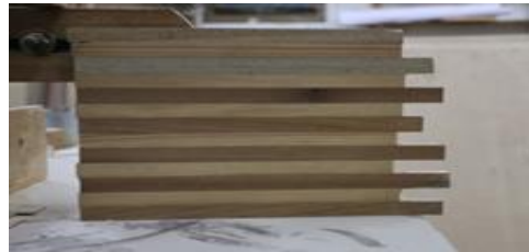
شكل (٢١) عملية الوصل بين أنواع الاخشاب