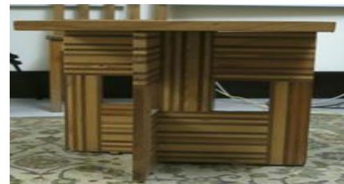
شكل (٢٦) المنضدة بصياغة التدوير