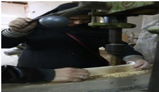
شكل (٨) متدربة اثناء تنفيذ النقر