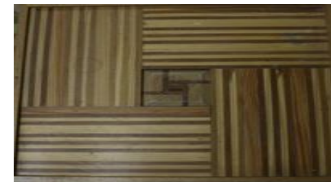
شكل (٢٥) سطح المنضدة بصياغة التدوير