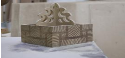
شكل (٢٠) أحد المكملات المنفذة بصياغة التفريغ