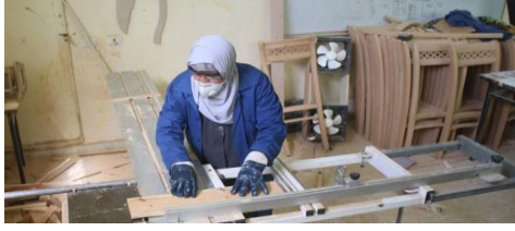
شكل (٢) صاحبة مشروع في أثناء العمل بورشتها الخاصة http://www.dotmsr.com

من خلال ضخ مزيد من الأموال في السوق التجارية، وتحسين صورة المشهد الاقتصادي، وكان شعارها «معاً نبني مستقبل مصر الريادي والاستثماري»، بالعمل الاجتماعي التطوعي لخدمة المرأة والطفل والبيئة.