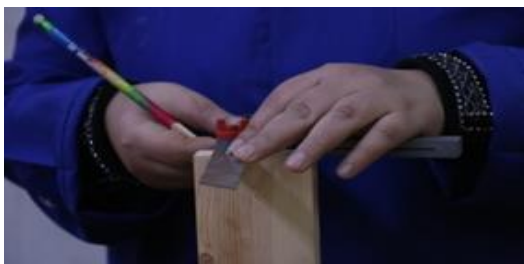
شكل (١٠) استخدام الكوستلا في رسم تعشيق الغنفاري