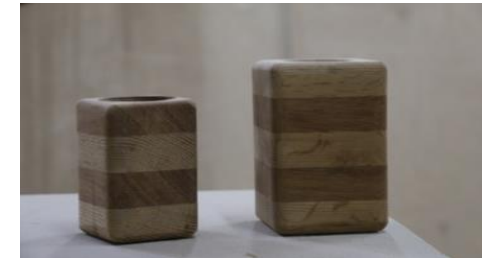
شكل (٢٣) مقلمة بصياغة التفريغ والتدوير