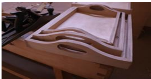
شكل (١٤) مكمل بسيط من الخشب "اطقم صواني"