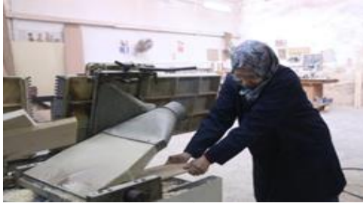
شكل (٤) متدربة مع ماكينة التخانة

المختلفة، ثم تنفيذ نوعين مختلفين من القواشيط، هم قشاط ذكر ونتاية، وقشاط مخفي لزيادة سمك الخشب، وتاسعا: شرح الحلايا والكرانيش، ومسمياتها وطرق تثبيتها، ثم كيفية تشكيل بعض أنواع الحلايا والكرانيش، مثل الشطف والتنهيز والجي والبسطوم.. الخ، تم عمل تقييم مرحلي لتقوم كل متدربة على حدة بتنفيذ ما يطلب منها من تمرين عملي مختلف لكل متدربة، ليكون هذا التقييم قبل الانتهاء من المرحلة الأولى لبرنامج تدريب المرأة.