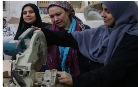
شكل (٥) المتدربات مع المدربة امام المنشار النصف محوري