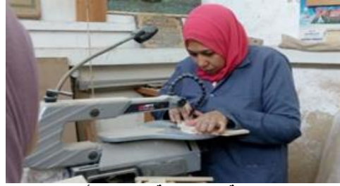
شكل (١٧) متدربة على ماكينة المنشار الأركيت الكهربائي