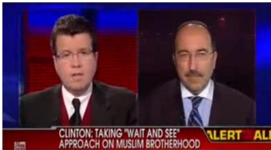
شكل (٦) التغطية الإخبارية اعتبرت الإخوان المسلمين العدو الفعلي