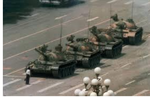
شكل (٧) متظاهر يواجه مدرعة