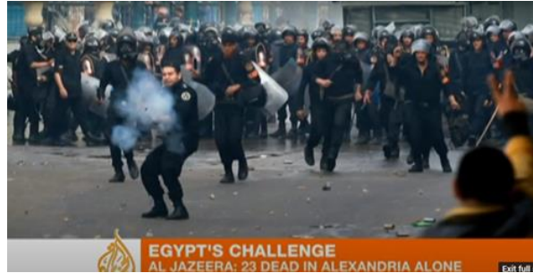
EGYPT'S CHALLENGE AL JAZEERA: 23 DEAD IN ALEXANDRIA ALONE