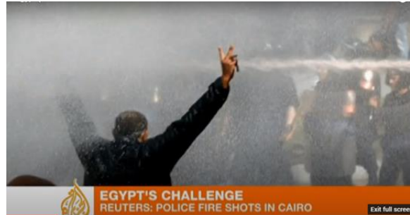
شكل (١١) تصور قناة الجزيرة الصراع ليس عنيفاً