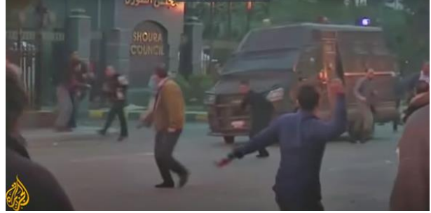
شكل (١٣) تنقل الجزيرة مستوي الصراع إلي العنف الكامن

انتقلت القناة في بعض تقاريرها إلي العنف الصريح وصار ممكنا أن نشاهد إطلاق نار واضح وقتلي ورغم ذلك تظل