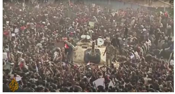
شكل (١) التفاف الشعب حول الجيش عند نزوله للميدان

لم تختلف تغطية FoxNews و CNN عن التغطية المعتادة لأحداث الشرق الأوسط فصورت سكان المنطقة على أنهم إما أصدقاء أو أعداء للولايات المتحدة ، (١٤-ص ٢٨٠) فصاغت الثورة المصرية من وجهة نظر مسؤولي حكومة الولايات المتحدة إذ أثارت الفوضى في شوارع القاهرة أو سيطرة الأصولية الإسلامية على مصر قلقهم ودفعتهم إلى الإصلاح السلمي ، والحكومات الحليفة ، ومراسلي القنوات ، و تناولت كيف يمكن أن تؤثر الثورة على مستقبل أمريكا بتقدم الثورة يتغير تصوير مبارك كصديق للولايات المتحدة بمرور الوقت على كلا القناتين بينما تستخدم وسائل الإعلام باستمرار إطار العدو للإخوان المسلمين. ولكنها تختلف حول ما إذا كانت جماعة الإخوان هي العدو المحتمل ، كما تري CNN ، أو العدو الفعلي ، كما تراها FoxNews. اتخذت FOX News موقفا معارضا بشكل مباشر من خلال تقديم تمرد الإخوان المسلمين بشكل سلبي وتقديم الحركة على أنها خطيرة على الديمقراطية المصرية بسبب طبيعتها الإرهابية . (٣-ص ٩٣) وبظل التعامل مع الجيش بإعتباره حليف للمتظاهرين وجزء من الشعب شكل (٣) و (٤) و (٥) و (٦) .