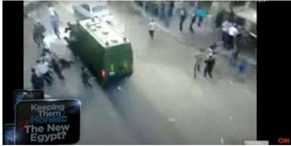
شكل (٢٢) الجيش المصري يستخدم القوة.