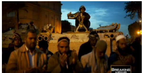
شكل (٥) الجيش والشعب في الميدان