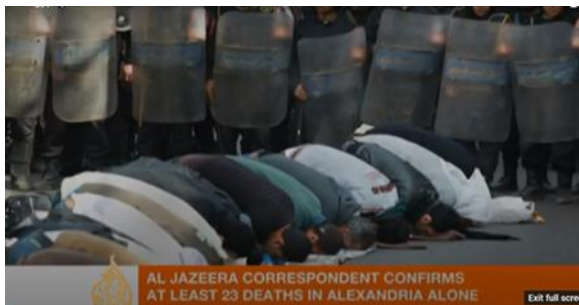
شكل (١٢) تصور قناة الجزيرة المتظاهرين سلميين

نستكشف في هذا البحث أن شبكة CNN أكثر ميلاً من AJE لتوظيف إطار الصراع - العنف الكامن، وأحياناً العنف الصريح أكثر من AJE التي كانت أكثر استخداماً لإطار الصراع ليس عنيفاً في حال تم حل النزاع سلمياً وبدون عنف، خاصة في بداية الثورة فكانت تعرض صوراً للمتظاهرين أو الجيش بدون أي مؤشرات على العنف شكل (١١) كان من المرجح أن تصور AJE صوراً للأشخاص المحتجين مع التأكيد على سلمية المتظاهرين والبعد الديني لأنه يلامس العاطفة وخاصة إذا كان المشاهد عربي مقيم في الخارج مثلاً فسيكون التأثير العاطفي لصور المتظاهرين السلميين يصلون مؤثر للغاية