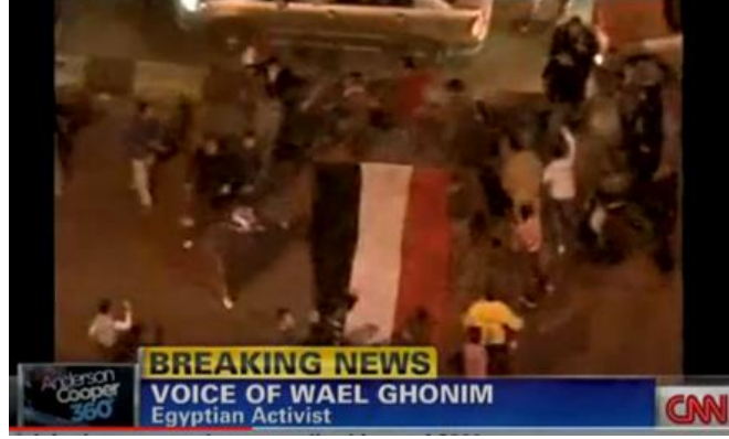
شكل (١٠) التغطية المرئية لتنحي مبارك في قناة CNN

من خلال توظيف ثنائية الصديق / العدو للولايات المتحدة في حدث لم يشمل الولايات المتحدة بشكل مباشر، يتم إعادة صياغة المشاركين في الثورة من المصريين الذين يقاتلون من أجل مستقبل بلادهم إلى الفصائل الأجنبية التي تؤثر على الولايات المتحدة. لا تتعلق الثورة بمصر فقط، بل بالولايات المتحدة أيضاً. (٣-ص ٩٢) لا تركز تغطية Fox News و CNN المبكرة على وضع المتظاهرين كصديق أو عدو للولايات المتحدة؛ بدلاً من ذلك، تشرح كيف تؤثر تصرفات المتظاهرين على الولايات المتحدة. في حالات نادرة، نقلت كلتا المنافذ الإخبارية اقتباسات من قادة الاحتجاج ينتقدون الولايات المتحدة ومع ذلك، فإن التقارير الإخبارية تضع هذه التصريحات كدليل على إحياء المحتجين من الولايات المتحدة. (١٩)