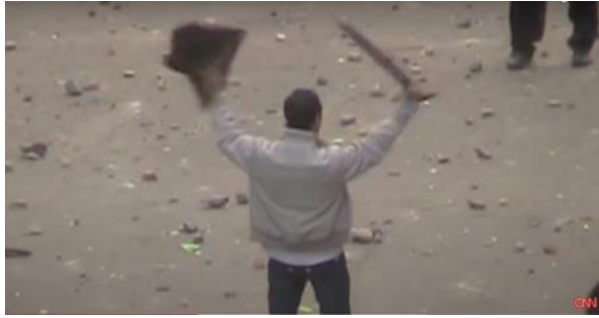
شكل (٢٠) تطور القناة التغطية إلى إطار العنف الكامن مع التأكيد على سلمية المتظاهرين