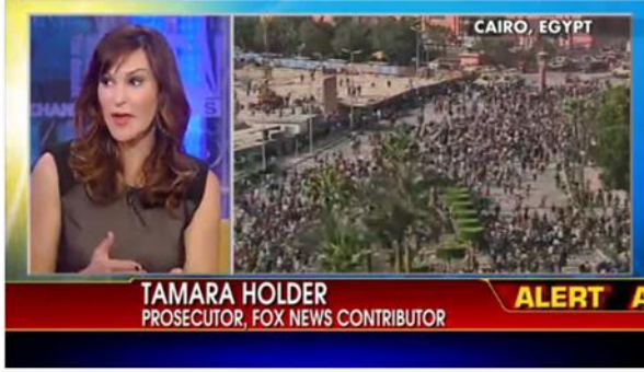
شكل (١٨) اعتمدت FOX News على التحليل للبت الحي للأحداث