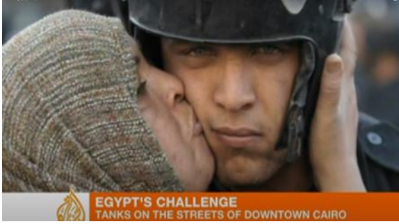
شكل (٢) امرأة تقبل عسكري جيش في الميدان