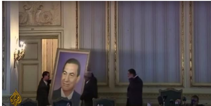
شكل (٩) إنزال صورة مبارك من القصر بعد التنحي

لكن قناة الجزيرة كانت أكثر شمولية في تناولها القصة بينما قناة CNN كانت تتمحور حول هذا الإطار وانخفض حجم التغطية المخصصة للانتفاضة المصرية بعد تنحي مبارك ، مما يشير إلى أن المتظاهرين قد "انتصروا" عرضت CNN قصة الاحتجاجات المصرية من خلال التركيز على ما فهمه المرسلون أن استقالة مبارك هي الفوز والنهاية . شكل (١٠) التغطية المرئية لتنحي مبارك في قناة CNN