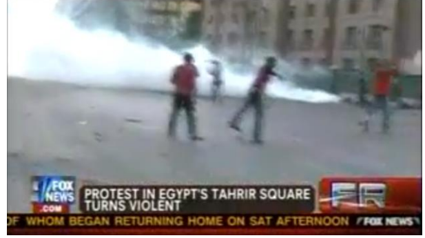
شكل (١٧) تستخدم FOX News إطار الصراع -العنف الكامن