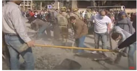
شكل (٣) صورة للجيش يمر عبر المتظاهرين في الميدان