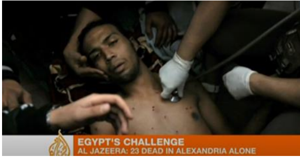
EGYPT'S CHALLENGE AL JAZEERA: 23 DEAD IN ALEXANDRIA ALONE

الجزيرة أقل عنفا في التغطية من القنوات الغربية شكل (١٥) و(١٦)