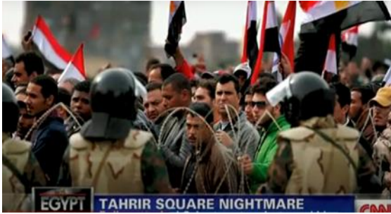
شكل (٤) يوضح سلمية الجيش في الميدان بين المتظاهرين

لم تختلف تغطية FoxNews و CNN عن التغطية المعتادة لأحداث الشرق الأوسط فصورت سكان المنطقة على أنهم إما أصدقاء أو أعداء للولايات المتحدة ، (١٤-ص ٢٨٠) فصاغت الثورة المصرية من وجهة نظر مسؤولي حكومة الولايات المتحدة إذ أثارت الفوضى في شوارع القاهرة أو سيطرة الأصولية الإسلامية على مصر قلقهم ودفعتهم إلى الإصلاح السلمي ، والحكومات الحليفة ، ومراسلي القنوات ، و تناولت كيف يمكن أن تؤثر الثورة على مستقبل أمريكا بتقدم الثورة يتغير تصوير مبارك كصديق للولايات المتحدة بمرور الوقت على كلا القناتين بينما تستخدم وسائل الإعلام باستمرار إطار العدو للإخوان المسلمين. ولكنها تختلف حول ما إذا كانت جماعة الإخوان هي العدو المحتمل ، كما تري CNN ، أو العدو الفعلي ، كما تراها FoxNews. اتخذت FOX News موقفا معارضا بشكل مباشر من خلال تقديم تمرد الإخوان المسلمين بشكل سلبي وتقديم الحركة على أنها خطيرة على الديمقراطية المصرية بسبب طبيعتها الإرهابية . (٣-ص ٩٣) وبظل التعامل مع الجيش بإعتباره حليف للمتظاهرين وجزء من الشعب شكل (٣) و (٤) و (٥) و (٦) .