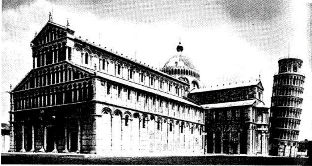
(شكل ١١) كاتدرائية بيزا Pisal معمار رومانسكى إيطالي (١٠٦٣م-١١١٨م) توسكانيا.

وقد تكون الأبراج متصلة مثل الأمثلة السابق ذكرها أو منفصلة مثل الكنائس الإيطالية، فنرى في مجموعة بيزا Pisa التوسكانية برج النواقيس منفصل ومستقل عن الأبنية (شكل ١١). كما اختلفت الأبراج في نهاياتها، فترمز أبراج الكنيسة إلى القوة والمسؤولية، والمقدرة. علاوة على ذلك فإن أحجام الأبراج والكنائس العملاقة تزيد من الخشوع لدى الزائرين، وترمز أيضاً للقوانين التي يدق ناقوس الكنيسة ليعلن عن الألوهية، بينما الحبل الذي يعلو البرج فهو ترتيل للتييمات السماوية. (14/ص150)