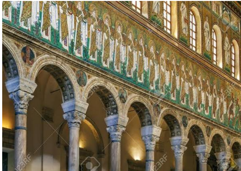
(شكل ١٥) الجدار الشمالي لصحن كنيسة أبولينار San Appollinare رافينا Ravenna - إيطاليا - فن بيزنطى (القرن السادس الميلادي)