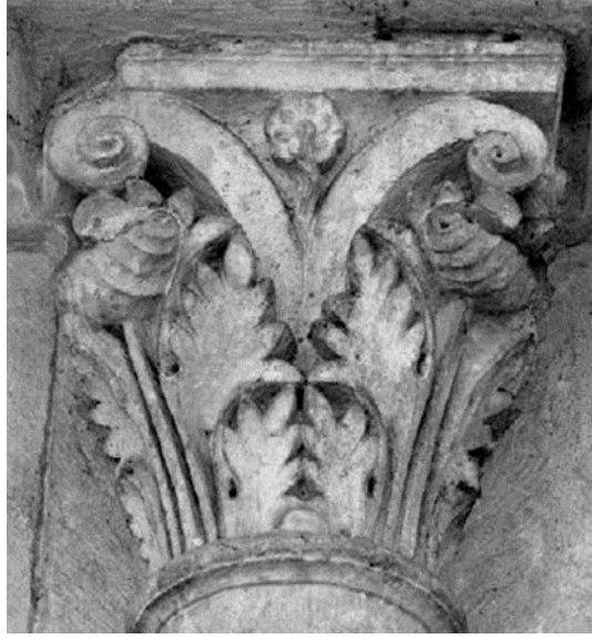
(شكل ١٦) تاج عمود مستمد من التيجان الكورنثية الرومانية. بكنيسة لامادلين La Madeleine - بفيزلای Vézelay فرنسا (١١٢٠م-١١٥٠م).

تمتاز تيجان الأعمدة بالأشكال النباتية مثل الكرمة Vine، وورقة الاكانتس Acanthus والأشكال الآدمية من الأساطير وقصص من العهدي القديم والجديد، علاوة على الأشكال الحيوانية في وضع المواجهة (وضع التقابل والتدابير) (شكل ١٧).