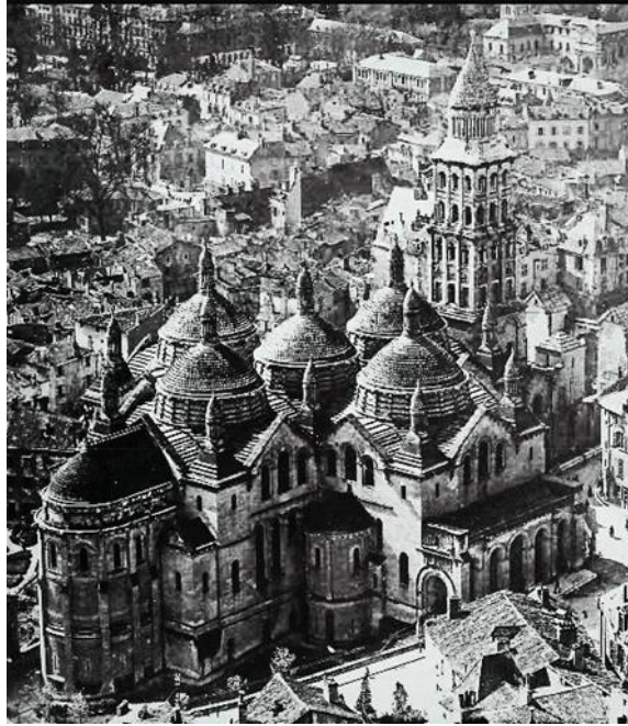
(شكل ٥ ب) كنيسة القديس فلورنت Saint Florent – فرنسا (١١٢٠م).