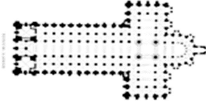
(شكل 3) مسقط أفقي لكنيسة سان سرنان San Sernin-فرنسا

ويرمز الصليب إلى الفداء، الخَلاص، والمسيح المخلص، كما ساهم هذا التخطيط على تقدم المؤمنين إلى داخل الكنيسة يؤدي المدخل إلى الرواق الرئيسي للكنيسة وعلى جانبيه عقود ودعائم سميقة. كما كان البهو الأوسط أكثر ارتفاعاً من الجناحين الآخرين. وتمتد فوق الرواق الرئيسي عقوداً على امتداد السقف من المدخل حتى الحنية الشرقية وبذلك يُنقل الثقل إلى البواكي والدعائم.