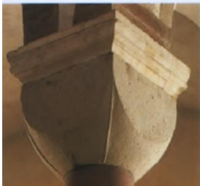
(شكل ١٣) تاج عمود في كنيسة القديسة مريم - كولونيا- ألمانيا (١٠٦٥م)

تمتاز الأعمدة في عصر الرومانيسك بتيجانها المختلفة كما يعد أبسط أنواعها النوع الذي على شكل سلة، وهو مكون من مكعب قطعت زواياه السفلي على شكل مستدير (شكل ١٣)، وهناك أشكال أخرى من التيجان المستمدة من الفنون الأخرى مثل الفن القبطي الذي أشتهر بتيجان الأعمدة السلالية (شكل ١٤)، الإسلامية، كما استمد الفن الرومانسكي تقسيم جدران الصحن من الفن البيزنطي (شكل ١٥)، و التيجان الكورنثية من الفن الروماني (شكل ١٦)، تفصل هذه الأعمدة بين الصحن والرواقان الجانبيان. (4/ص64).