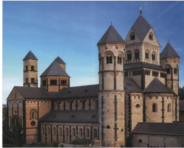
(شكل ١٠) كنيسة ماري لاخ Maria lach-ألمانيا (١١٥٦م-١١٧٧م) - كنيسة سرنان Sernin - تولوز-فرنسا (١١٨٠م)