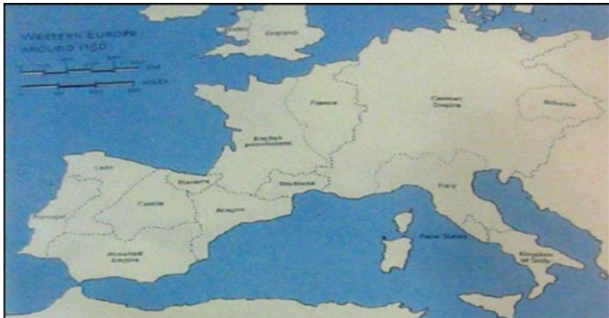
(شكل 1) خريطة لغرب أوروبا في فترة الرومانيسك ١١٥٠م