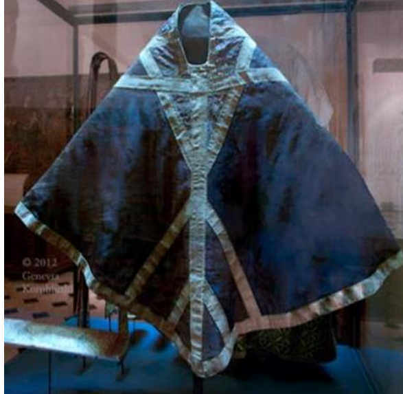
(شكل ١٨) حلة قداس القديس توماس بيكت Thomas Becket كاتدرائية سنس sens- فرنسا.

حلة القداس Chasuble: رداء خارجي بدون أكمام يرتديها رجال الدين من أجل الطقوس الدينية وهي عبارة عن قطعة قماش بيضاوية (أشبه بالمثلث) بها فتحة من المنتصف حتى يستطيع الكاهن تمرير رأسه كما تمتد أسفل الركبتين من جميع الجوانب). كل هذه الثياب عليها زخارف رمزية أكثرها ظهوراً his وهي أوائل كلمات ( jesus Huiss soter ) أي عيسى ابن الله المنقذ. (١٦/ص ١٢٠) (شكل ١٨)