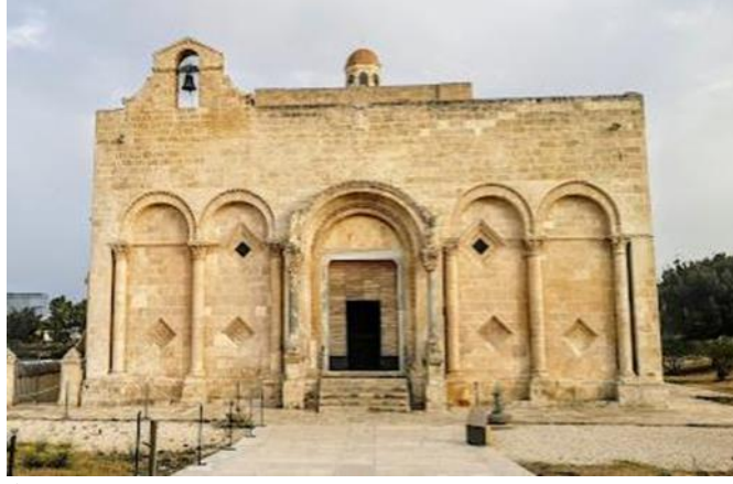
(شكل ٥ أ) كنيسة سانت ماريا دي سيونتو Saint Maria di Siponto – إكوليا Apulia إيطاليا (بداية القرن الثاني عشر الميلادي).