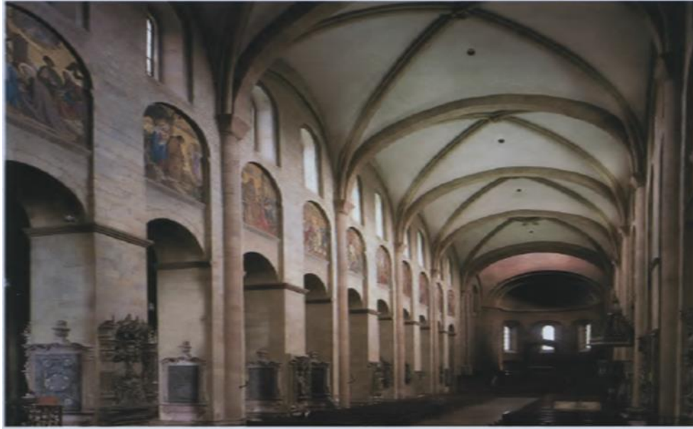
(شكل ٨) صحن كاتدرائية مينز Mainz-ألمانيا. (١٠٨١م-١١٣٧م).

وفي بعض الأحيان يشير صحن الكنيسة (شكل ٨) للكنيسة نفسها. كما يرمز لهؤلاء الذين يخدمون الله في الحياة العملية. كما يتم إضاءة صحن الكنيسة بواسطة صف من النوافذ Clerestory بالقرب من السقف، فترمز النوافذ الشفافة بالعلماء اللاهوتيين المحاربين للبدع ويعملون على نشر تعليم الدين، بينما التصاویر الموجودة على الزجاج المعشق فترمز إلى أفكارهم (١٣/ص ١٥٠).