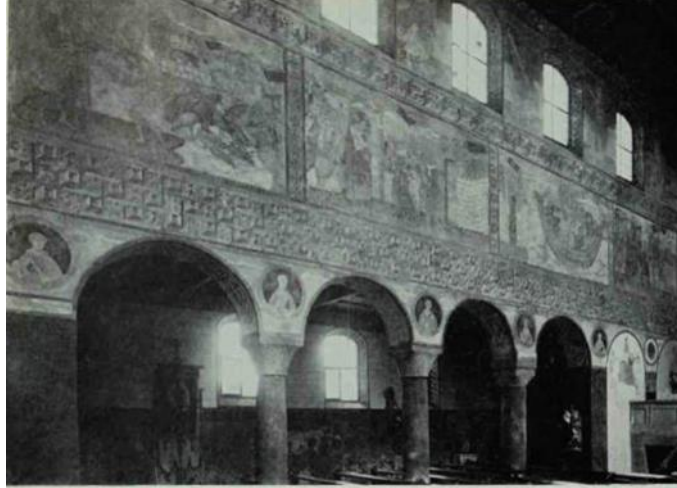
(شكل ١١) جدار الصحن الشمالي لكنيسة سان جورج San George - جزيرة رايشناو Reichenau-ألمانيا (القرن العاشر) .