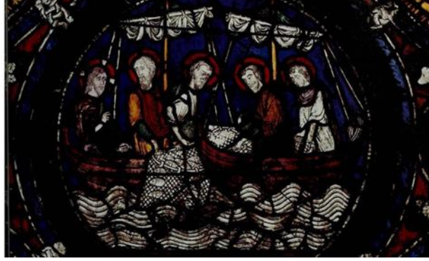
(شكل ٩) نافذة من الزجاج المعشق في كاتدرائية كانتربري Canterbury تمثل أعجوبة صيد الأسماك - إنجلترا (١١٨٠م-١١٩٠م)

Bartholomew. فقال لهم يسوع ألقوا بالشبكة على الجانب الأيمن فلم يستطيعوا أن يجذبوا الشبكة من وفرة السمك، كما تدل حركة يد المسيح إلى البركة، تدور أحداث هذه المعجزة في بحر طبرية .