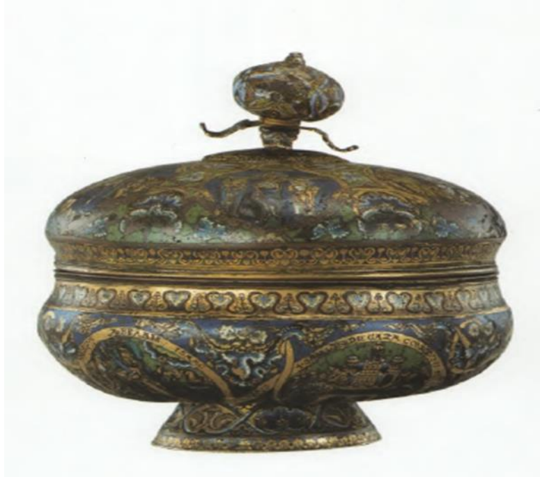
(شكل ٦) إنجلترا ١١٦٠م-١١٧٠م - متحف فيكتوريا وألبرت

يرمز إلى الحضور المقدس للمسيح وهو قائم بين الأموات، ويشبه الخيمة التي حُفظ فيها تابوت العهد عادة ما يكون خارج الحرم الكنسي وفي الجانب الشمالي من الكنيسة. كما يوضع علي المذبح وعاء يعرف باللاتينية Ciborium: وهو عبارة عن وعاء بغطاء حيث يتم حفظ قطع الخبز (شكل ٦).