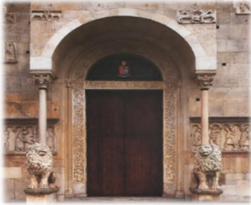
(شكل ١٢) بوابة الواجهة الغربية- كاتدرائية سان جيمينيانو San Geminiano - مودينا Modena إيطاليا (بداية القرن الثاني عشر الميلادي).