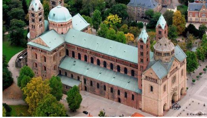
(شكل ٤) منظر خارجى لكاتدرائية شباير Speyer ألمانيا (١٠٦١م)

يتحكم المناخ في شكل أسقف الكنائس في العصور الوسطى من مكان لآخر. فتقع المنطقة البحثية ماعدا الأجزاء الجنوبية ضمن مناخ أوروبا القارى الذى يتسم بالبرودة الشديدة. لذلك الأسقف المائلة (الجمالونية أو الهرمية ) هي الخيار الأمثل في المناطق ذات الأمطار الغزيرة والتلوج حيث تساعد هذه الأسطح على إنزلاق الأمطار و عدم تكثفها على الأسقف. (شكل ٤)