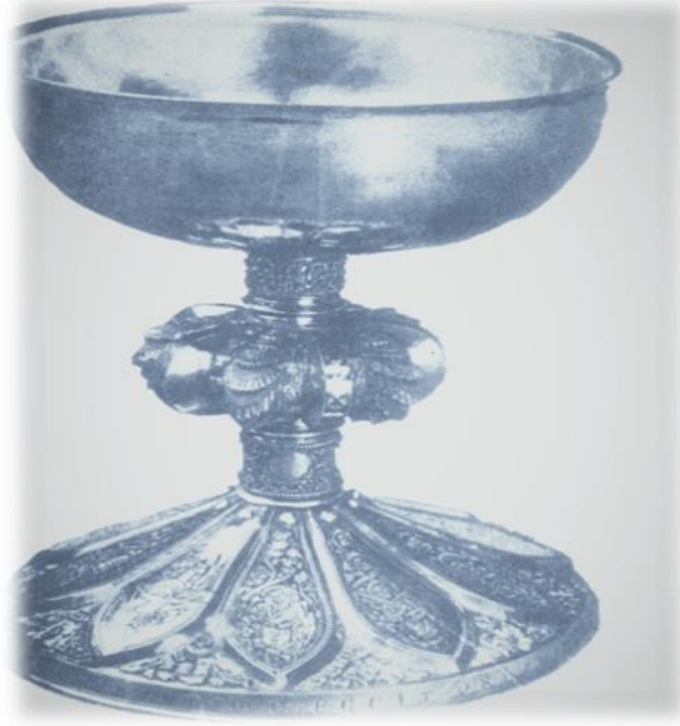
(شكل ٧) كأس منالولة من الفضة المذهبة المشغولة. دير نوتردام Notre Dame – فرنسا.

الإسفنجة Sponge تعيد إلى أذهاننا عندما قام الصالبون بإعطاء يسوع المر والخل. وهي عبارة عن منديل صغير لا يلمسه إلا خدام المذبح كما ينشف بها الكأس والصينية.