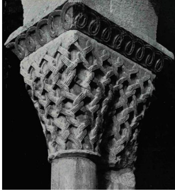
(شكل ١٤) تاج عمود كنيسة سانت برتاند دي كومنجس - Saint Bertand De Commings فرنسا (١١٠٠م) فن رومانسكى.