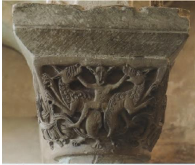
(شكل ١٧): تاج عمود في سرداب كنيسة كانتربري - إنجلترا (1100م-1120م)

تمتاز تيجان الأعمدة بالأشكال النباتية مثل الكرمة Vine، وورقة الاكانتس Acanthus والأشكال الآدمية من الأساطير وقصص من العهدي القديم والجديد، علاوة على الأشكال الحيوانية في وضع المواجهة (وضع التقابل والتدابير) (شكل ١٧).