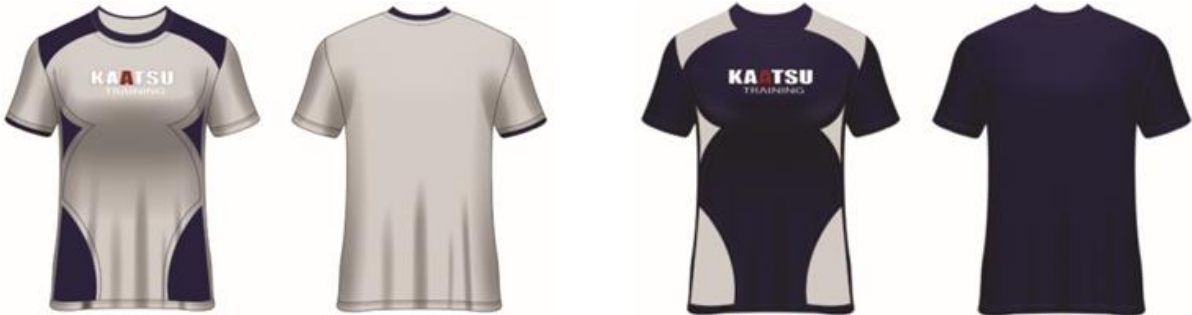
صورة (٤) المبراج للتصميم المقترح (٢)