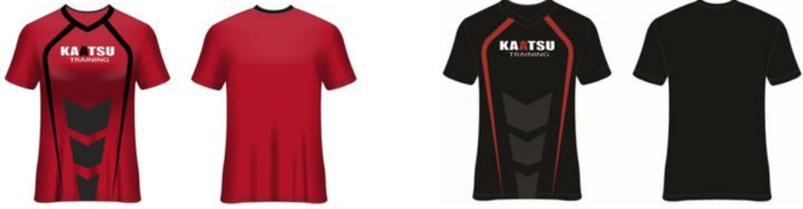
صورة (٢) المبراج للتصميم المقترح (١)

بعض التصميمات المقترحة الثلاثة للتيشيرت الرياضي المبتكر قبل اضافة اضافة شريط الـKAATSU التصميم الأول :-