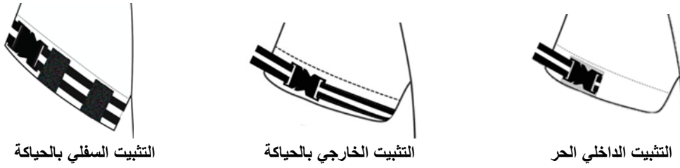
صورة (٧) توضح طرق تثبيت شريط الكاتسو