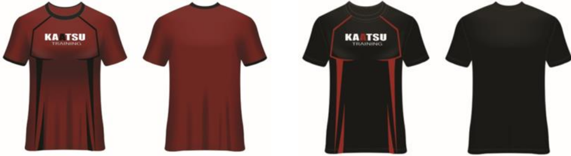
صورة (٦) المبراج للتصميم المقترح (٣)