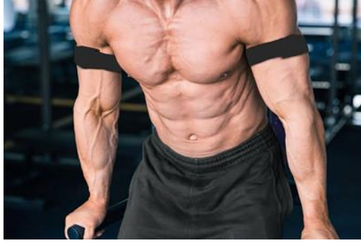
توضح هذه الصورة شكل شريط الـ KAATSU ومكان تواجده على العضلة عند الذراع أثناء فترة التدريب .