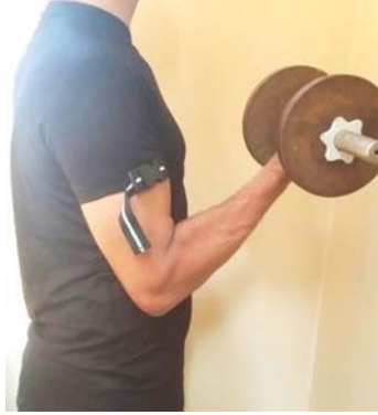
صورة (٨) التثبيت الداخلي الحر لأشرطة الكاتسو بالتشيرت