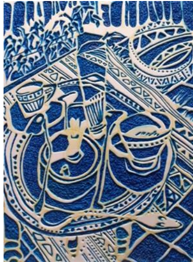
شكل (18) القالب الطباعي ال Key block من الفوم المرن والمدعم بطبقة من الخشب المصنع MDF فى صورته النهائيه بعد الإنتهاء من عمليات الضغط عليه بالقلم الجاف الأزرق والمنفذ من قبل الباحث ضمن التجربة العمليه للباحث ليصبح جاهز لتحبيره بالحبر الطباعي الأسود وطباعته وأخذ النسخه الطباعيه منه.