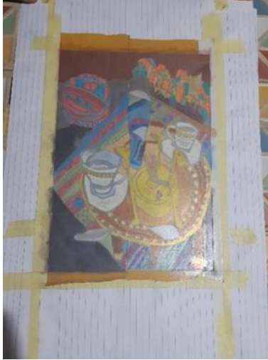
شكل (27) النسخة الطباعية في المرحلة قبل الأخيرة من طباعه القالب الطباعي key block المحبر بالحبر الطباعي الأسود