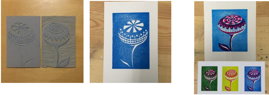
أشكال (2) تتابع مراحل الحصول على النسخة الطباعية الملونة من القوالب الطباعية المتعددة Multible plates

ولاسيما" على فناني الطبعه الفنية والذين ما زالوا مصرين على تفريغ طاقاتهم الإبداعية بالطرق الطباعية التقليدية ، وما زالوا مصرين على الحفاظ على هوية ذلك الفن وتفردة بين أفرع الفنون التشكيلية الأخرى ، دون الإنحراف إلى الأدائيات المستحدثة التي أفقدت ذلك الفن الكثير والكثير من الشحنات الإبداعية لدى فناني الطبعه الفنية بسبب النزوح إلى الأدائيات الترقية الرقمية وما تتضمنه من تدخل يكاد يكون كليا" من قبل تلك الآلة الرقمية التي أفقدت الطبعه الفنية هويتها وأصالتها بل وأصبحت سد منيع يفصل بين الفنان الطباعي وإنفعالاته المباشرة والصريحة على سطح القالب الطباعي . لذا كان من الضروري التصدى والوقوف فى مواجهه كل هذه العوامل من أجل التوصل إلى بدائل وحلول بسيطه تتماشى مع طبيعة الظروف الخاصة والطارئة التى تستجد على فناني و محبى الطبعه الفنية ، دون التنازل عن ما يميز الطبعه الفنية من أدائيات إنفعالية مباشرة على أسطح القوالب الطباعية والتي يجد فيها الفنان الطباعي المنتفس الحقيقى لتفريغ طاقاته الفنية وشحناته الإبداعية .