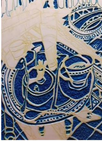
شكل (4) القالب الطباعي البارز البديل والمنفذ من قبل الباحث من خلال افرخ الفوم المرن تظهر عليه المناطق الغير طباعية والمضغوطة باللون الازرق

الفوم المرن المدعم من الخلف بطبقة من الخشب المصنع الـ MDF شكل ( 3 ) كقالب محدد لعناصر الشكل ومفرداته . Key block ليتم التعامل معه والحفر عليه من خلال الاستعانة بالاقلام الجاف للضغط على تلك السطح الطباعي المرن للحصول على مناطق طباعية بارزة لم يتم الضغط عليها بالقلم الجاف وايضا مناطق غير طباعية تم الضغط عليها بواسطة القلم الجاف والتي تظهر باللون الازرق على سطح القالب الطباعي شكل ( 4 ) .