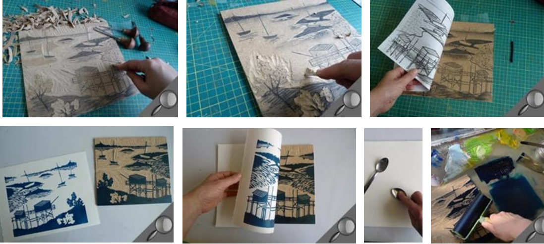
أشكال (1) تتابع مراحل الحصول على النسخة الطباعية من القالب الطباعي البارز الهالك Reduction plate