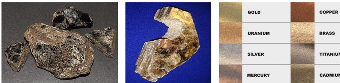
شكل (6) عينات من الصخور المعدنية التي يستخرج منها مسحوق الميكا