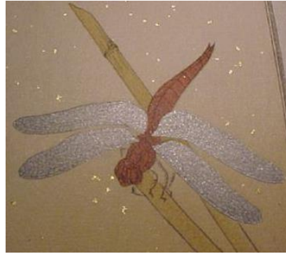
شكل (13) تطبيق لمسحوق بودرة الميكا Mica powder في تصميم حشرة اليعسوب