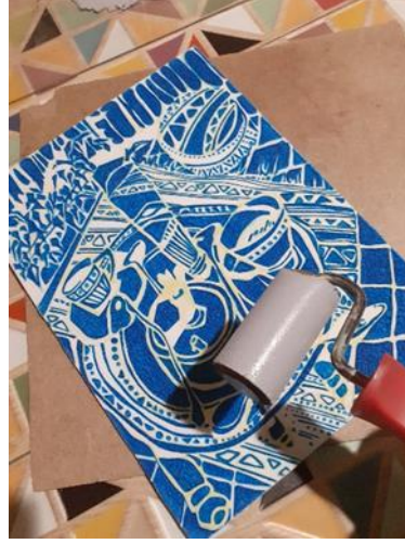
شكل (20) تحبير القالب الطباعي بحبر طباعي ذو لون محايد لطباعته على النسخه الطباعية قبل تدعيمها بالطبقة الاصقه double face