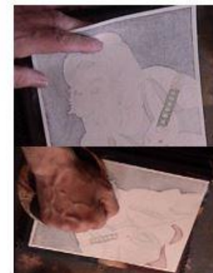
شكل (14) تطبيق لمسحوق بودرة الميكا Mica powder في خلفيه تصميم بورتريه والذي يتم فيه توزيع بودرة الميكا باستخدام مصفاة سلك ( 1795 م )