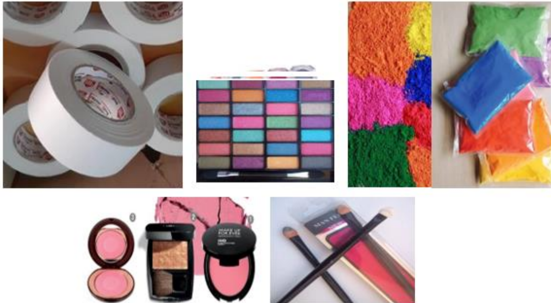
الخامات والأدوات التى استعان بها الباحث فى المرحله الثانية من التجربة العمليه للباحث " الاشرطة اللاصقه double face ومساحيق الألوان ومساحيق بودرة الميكا Mica powder