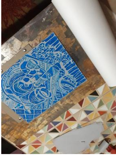
شكل (21) تثبيت ورقة الطباعة ( الكانسون الابيض ) على منضده الطباعة بدبابيس التثبيت لضمان ثباتها هي الأخرى فى مراحل التجربة

وفي هذه التجربة استطاع الباحث الحصول على طبيعة وحالة لونية وتعبيرية مختلفة تمامًا عن تلك التي يمكن الحصول عليها من أدائيات التحبير التقليدية بالأحبار الطباعية ، فنجد أن طبيعة اللون هنا بدت أكثر نعومه وضبابيه أضفت على العمل الفنى صبغة و طبيعة حالمة وحالة تعبيرية خاصة ومتفردة نظرا" لما تتميز به هذه المساحيق اللونية بنعومه ومظهر متألئء.