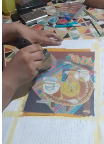
شكل (26) ازاله الزائد من مساحيق الالوان بفرشاه عريضه وناعمه بعد الانتهاء من توزيع القيم اللونية على النسخه الطباعية