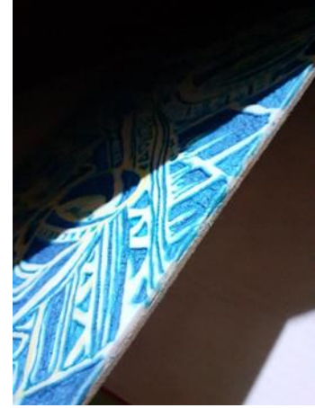
شكل (3) رؤية جانبية للقالب الطباعي البارز البديل والمنفذ من قبل الباحث من خلال افرخ الفوم المرن المدعم من الخلف بطبقة من الخشب المصنع MDF