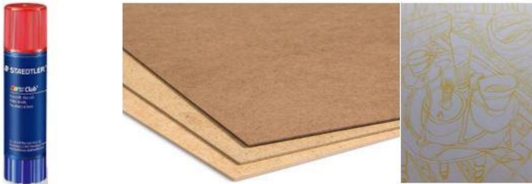
شكل (16) القالب الطباعي البديل من البورو ( 30 × 25 سم ) وعليه مفردات التصميم والذي تم تدعيمه بطبقة من الخشب المصنع MDF ولصقه بأصابع الشمع اللاصقة Glue stick