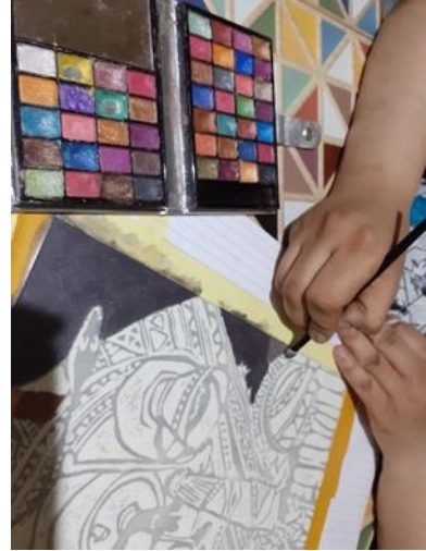
شكل (25) تدعيم الطبقة اللاصقه بمساحيق الالوان بواسطة الفرش ذو النهايات الاسفنجيه وفقاً لمفردات وتفصيل النسخه الطباعية