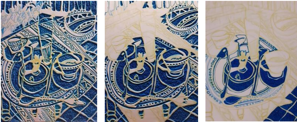
شكل (17) صور القالب الطباعي ال Key block من الفوم المرن والمدعم بطبقة من الخشب المصنع MDF وتتابع مراحل عمليات الضغط بالقلم الجاف الأزرق

بعد الإنتهاء من إعداد القالب الطباعي ال key block من خامه الفوم المرن " البورو " والمدعم من الخلف بطبقة من الخشب المصنع MDF قام الباحث برسم مفردات العمل عليه والمتمثلة فى لقطه لمنضده القهوة من خلال التعبير المباشر على سطح القالب الطباعي ورسم مفردات العمل عليه مباشرة بالقلم ، لتتم متابعه عمليات الضغط على القالب الطباعي بإستخدام القلم الجاف الأزرق للحصول على القالب المحدد لعناصر الشكل والتصميم Key block والمشمتمل على مفردات العمل فى صورة تحديدات خطيه وملامس وتأثيرات للمفردات المشتمل عليها التصميم المنفذ من قبل الباحث أشكال (17) . والتي يتضح فيها دور الأقلام الجاف فى الضغط على خامه الفوم المرنه والتي تظهر باللون الأزرق على سطح القالب الطباعي تاركة ما بين تلك المساحات الزرقاء من تحديدات خطيه وملمسيه بالأبيض وهى المناطق والفراغات التي لم يتم الضغط عليها بالقلم الجاف الأزرق ، ليتم تحبيرها بعد ذلك بالحبر الطباعي " الكينو " الأسود ذو القاعدة الزيتية بواسطه اسطوانات التحبير المرنه وأخذ نسخه طباعيه من تلك القالب الطباعي على ورقه الطباعه ليتم الأنتقال للمرحله الثانيه من التجربه الخاصه بالباحث وهى مرحله تدعيم النسخه الطباعيه المأخوذه من القالب الطباعي المرن ال Key block بمساحيق الألوان بمختلف نوعياتها وطبيعتها سواء اللامع منها أو البدائل من بودرة المساحيق المتداول العمل بها فى الأمور الحياتيه البسيطه كمستحضرات التجميل والطباشير وبودرة تلوين الطعام وظلال الجفون وبودرة الكريستال وغيرها .