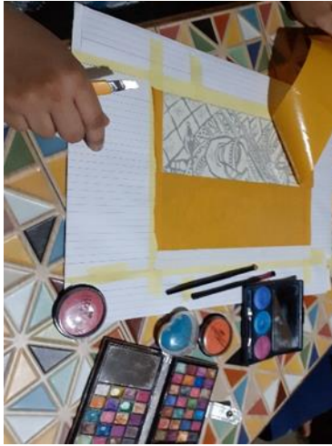
شكل (24) نزع الدعامة الورقيه للطبقة اللاصقه لتظهر من اسفلها ملامح النسخه الطباعية إستعدادا" لاستقبال مساحيق الالوان