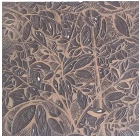
شكل (5) نموذج لقالب key block من اللينوليوم يشتمل على تفاصيل ومفردات العمل الفني وهو منفذ من قبل الباحث وتم الحفر عليه من خلال الاستعانة بأدوات الحفر المخصصة للحفر على تلك النوعية من القوالب الطباعية

ما هو القالب الـ Key block ؟ حرفيا" يمكن القول بأنه هو مفتاح العمل الفني المطبوع . (14) فهو ذلك القالب الذي يحتوى على معظم تفاصيل عناصر العمل أو التصميم ، شكل (5) لذا فهو بمثابة دليل لتحديد الألوان المتمثلة في عناصر ومفردات العمل بعد طباعتها سواء من القالب الطباعي المجزأ Divided block ، أو من القوالب الطباعية المتعددة Multiple plates . (15)