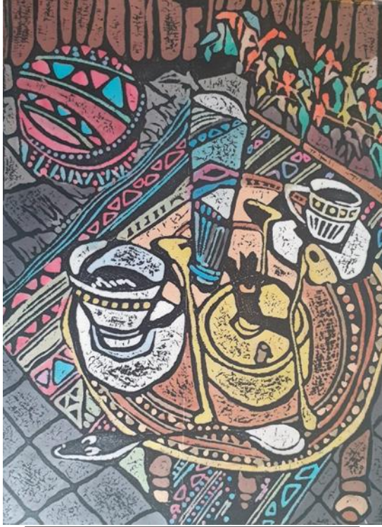
شكل (32) النسخة الطباعية المأخوذة من القالب الطباعي البارز المنفذ من قبل الباحث والملونه بقيم لونه مغايرة بمساحيق الألوان ( مساحيق بودرة الميكا (Mica powder)