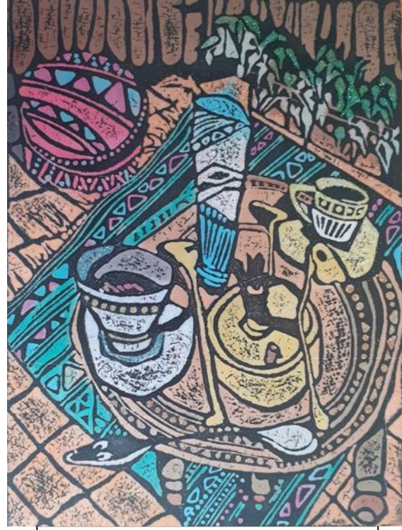
شكل (31) النسخة الطباعية المأخوذة من القالب الطباعي البارز المنفذ من قبل الباحث والملونه بمساحيق الألوان ( مساحيق بودرة الميكا ) ومساحيق بودرة الكريستال

بعد الإنتهاء من مراحل تنفيذ التجربة الخاصه بالباحث تفصيليا":