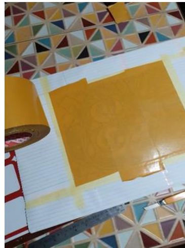
شكل (23) تغطيه حدود النسخه الطباعية ب وحمايه هوامش ورقه الطباعة بعمل من الورق للحفاظ على نظافه هوامش mask النسخه الطباعية