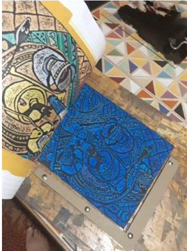
شكل (30) تثبيت النسخه الطباعية الملونه بمساحيق الالوان في نفس مكان التثبيت على منضده الطباعه لمعاودة الطباعه عليها بالحبر الطباعي الاسود