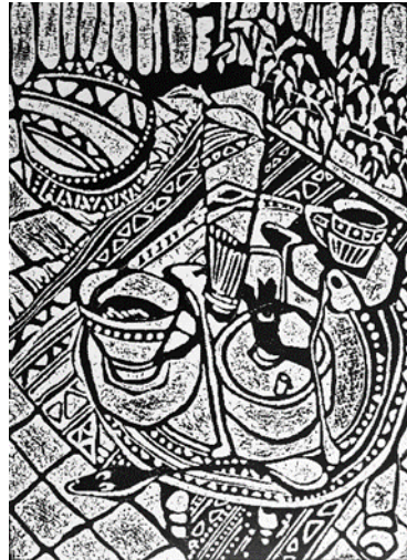
شكل (29) نسخه طباعيه بالأبيض والأسود مأخوذة من القالب الطباعي تتضح فيها ملامح وتفصيل العمل ومفرداته