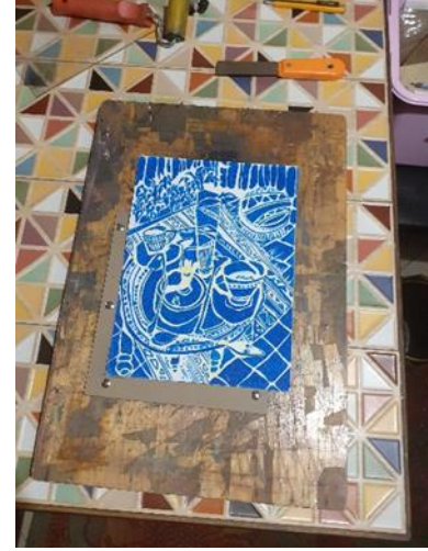
شكل (19) القالب الطباعي البارز بمقاس (25 x 30 سم ) على منضده الطباعة مرتكز على زاوية التثبيت لضمان ثبات وضعه فى مراحل تجربته المتتاليه