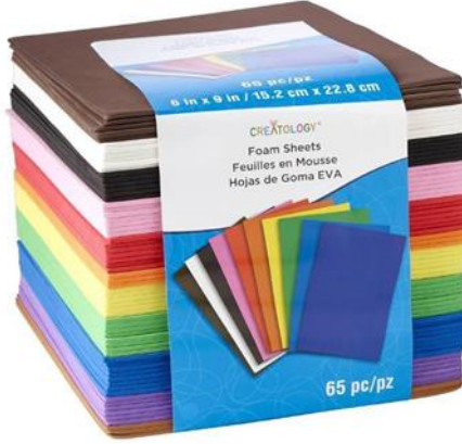
افرخ الفوم المرن ذو ثخانه 1 مم والذي تم الاستعانة به في تنفيذ القالب الطباعي البارز البديل Foam sheet