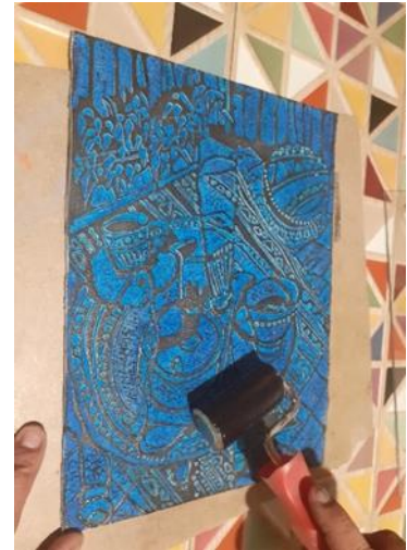
شكل (28) تحبير القالب الطباعي البارز المنفذ من قبل الباحث من البورو بالحبر الطباعي الأسود بواسطة اسطوانه التحبير