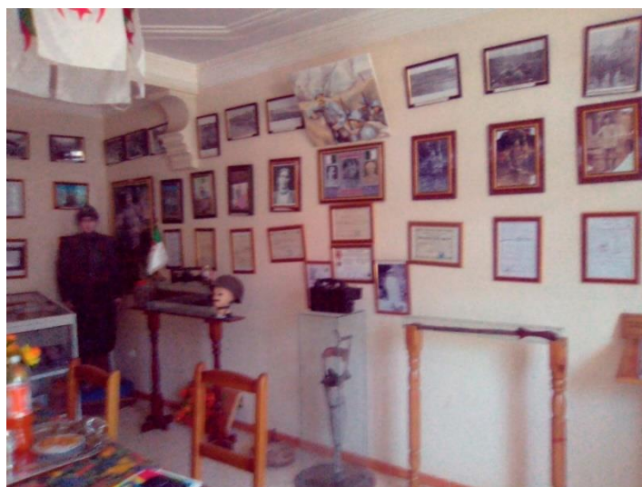
شكل رقم 04: صورة لجانب من متحف جمعية الطاهر بن شعبان الثقافية والتاريخية

ومن بين المجالات التي برزت بشكل ملحوظ عند الزيارات الميدانية ومن خلال المقابلات التي أجريت مع الجمعيات والتي يمكن اعتبارها قاسما مشتركا بين الجمعيات المدروسة وهو امتلاك معظمها رصييدا من الأغراض والأدوات التقليدية التي كان الانسان الورتلاني يستعملها في حياته اليومية، حيث أن الجمعيات عادة ما تعرضها خلال التظاهرات الثقافية على أساس أنها جزء من التراث المادي المحلي (شكل رقم 03). وتجدر الإشارة أن معظم هذه الأرصدة لم ترق لكي تنظم على شكل متاحف يكمن زيارتها بشكل منتظم ما عدى متحف بني حافظ الذي أسسته جمعية ثيويزي الثقافية 21 ومتحف بلدية بني ورتلان. وفي سياق متصل وجدنا كذلك مجموعة هامة من الاثار المادية المتعلقة بالثورة التحريرية في كل من متحف قرية بني حافظ ومتحف بلدية بني ورتلان ولعل أبرز مجموعة سمحت لنا الفرصة لمعاينتها هي ما يتضمنه متحف جمعية الطاهر بن شعبان الثقافية والتاريخية المتكون من الشواهد والاثار التي تخلد مآثر ومسيرة هذا الرجل (شكل رقم 04) 22 .