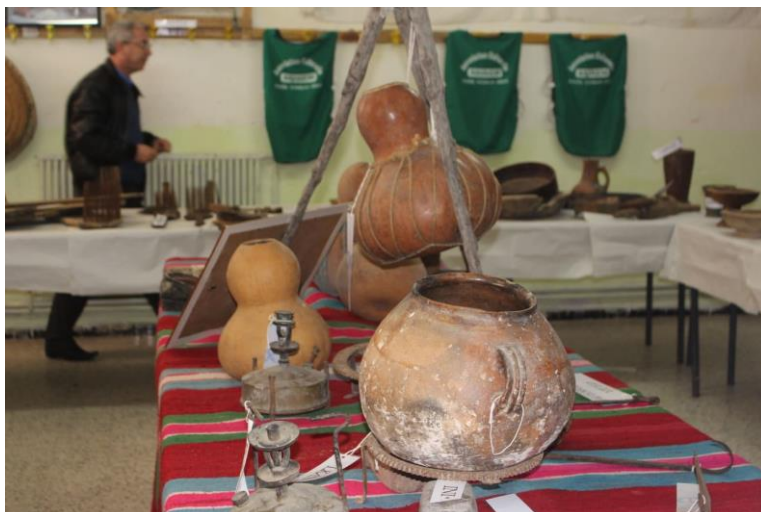
شكل رقم 03: صورة لجانب من معرض الأثاث التقليدي للجمعية الثقافية أسير الميسان

أسست ورشات للتكوين في الخياطة بالتنسيق مع مركز التكوين المهني والتمهين ببني ورتلان الذي يساهم في متابعة وتأطير هذا النشاط.