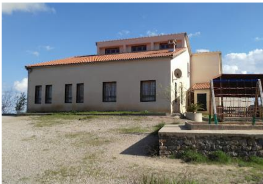
شكل رقم 05: صورة لخان دلاقة بطل على مناظر جميلة في منطقة بني ورتلان