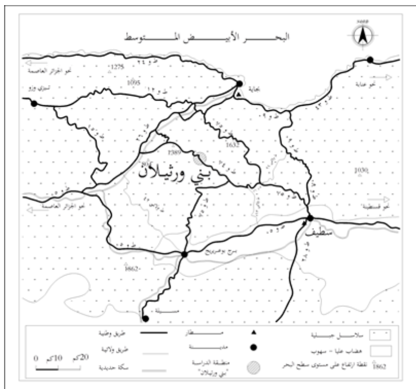
شكل 01 : خريطة موقع منطقة بنى ورتلان ضمن الإطار الجغرافي الجهوي المصدر: (FONTAINE, 1983, p.91) + معالجة الباحث (كزار، 2008، ص95)

أما استقرار الانسان في المنطقة فيعود إلى الفترة القديمة أو ما قبلها حيث تدل الاثار التاريخية على استقرار الرومان فيها إلى جانب السكان المحليين، انظر الشكل رقم 02. ويتمثل التوطن البشري السائد في المنطقة قبل وإبان الحقبة الاستعمارية الفرنسية أساسا في القرى والمداشر القبائلية وبعض الثكنات والمرافق المشيدة من قبل سلطات الاحتلال وبعد الاستقلال تطور الوضع ونمت القرى وأصبح البعض منها تجمعات سكانية كبيرة بينما فقدت أخرى كل أو جل سكانها وأصبحت جردا ذلك أطلالا وتراثا شاهدا على تاريخ المنطقة.