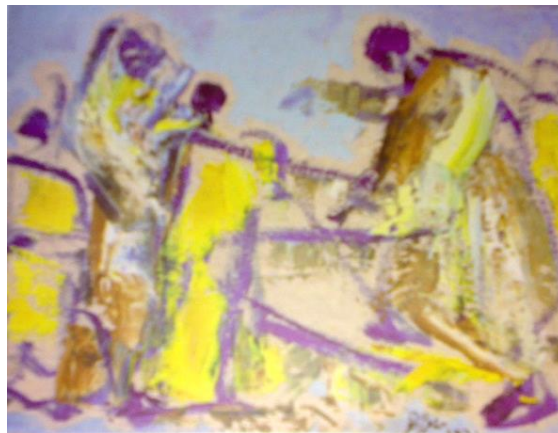
شكل (٢) صلاح طاهر - ١٩٦١ - ألوان زيت - ٢٥ x ٢٠ سم .

ومنذ فجر الستينات تحول أسلوبه إلى التجريدية التعبيرية ، قدم مجموعة من التكوينات اللونية تحت أسم تكوينات تجريدية تعبيرية فهو يقول " كان عام ١٩٦٠ هو عام الرسوخ والعثور على نفسي تماما" (٢) . وجذبته تلك الحرية الكاملة التي تنتجها التجريدية دون الالتزام بالواقع كما في شكل (٢) .