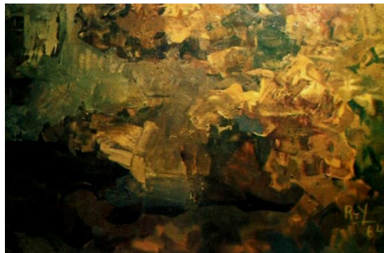
شكل (١٤) رمسيس يونان - زيت على توال - ١٩٦٤ .