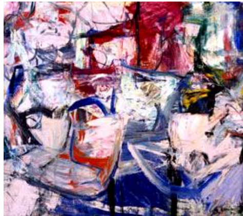
شكل (٣) دي كوننج - ليلة السبت ١٩٦٥ زيت على توال .

أعماله تجريدية تعبيرية رغم أن بعض الرموز قد تبدو أحياناً بألواناً ناصعة يظهر فيها الأحمر مختلطاً بملاصق من ألوان أخرى ، وخطوط الفرشاة تبدو واضحة وجريئة ، كل هذا من مقومات صور دي كوننج ، كان يضع بقعاً سميكة من الألوان بالفرشاة على اللوحة ، ثم يحرك هذه البقع في اتجاهات مختلفة بيده ، ثم يضيف إليها لمسات من خطوط سوداء . لذلك كان إحساسنا بهذه الخطوط أكثر من شعورنا بالألوان ، فأعماله قوية متنوعة ، وأشهر لوحاته السلسلة المتعددة الأشكال عن النساء ، وتبدأ هذه اللوحات بالتعبير عن المظاهر الجنسية بطريقة بدائية فجأة ، ولكن الصور التالية لتلك المرحلة كان فيها جمال خارجي ، وله سلسلة من المناظر الطبيعية الريفية المؤثرة والمثيرة للعاطفة والإعجاب والتي تحوم حول التجريدية بصفة عامة ، كانت أعماله موزونة ، فكان يستنبت وسيلة لينقل عبقرية دون أن يقع في أخطاء التفاصيل ، وبهذا تمتلك لوحاته قوة لتلعب بخيال المشاهد، فن دي كوننج يعتمد على دوافع الداخلية ، وعلى تنظيم الصدفة ، ويحمل منه امتداد للنزعة الأوتوماتية التي أوجدتها الحركة السيريالية ، وتتميز بقوة الحركة وحيويتها . ويخضع تصويره للتنظيم الوقت الذي يتبع الأحساس المباشر باللون وباتجاهات الفرشاة ، ولا يرتبط فن دي كوننج بالتقاليد المعروفة للتصوير التمثيلي أو تسجيل الطبيعة الظاهرية . إنه يعتمد على فن تكوين الصورة في ذاته على أساس أن هذا التكوين هو المضمون الحقيقي للعمل الفني ، ويترجم الفنان كل إنفعالاته إلى إحساسات تشكيلية مقنعة ، وتخوض الرائي في عالم من الألوان التي نظمت بانفعالات الفنان المتدفقة والتي تتضمن النمو المستمر ، والحركة الدائبة والتغيير.