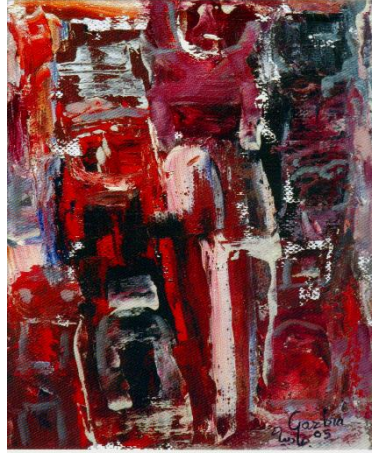
شكل (١٠) جاذبية سري - زيت على توال - ٤١ x ٢٧ سم ٢٠٠٥