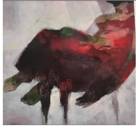
شكل (٨) الفنانة سهيلة حسين النجدي ، من مجموعة الكرسي، مواد مختلطة على كانفس، ٢٠١٧، ١٢٠ x ١٢٠