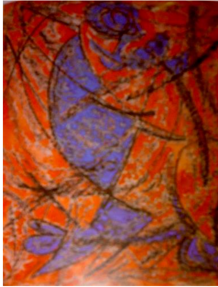
شكل (١٥) صلاح طاهر - ألوان جواش وشمع - ٥٠x٣٥ سم .

منذ فجر الستينات أصبح أسلوبه إلى التجريدية التعبيرية ، قدم مجموعة من التكوينات اللونية تحت أسم تكوينات تجريدية تعبيرية فهو يقول " كان عام ١٩٦٠ هو عام الرسوخ والعثور على نفسى تماما" (٢٦). وجذبه تلك الحرية الكاملة التي تتيحها التجريدية دون الالتزام بالواقع، صلاح طاهر يعرف التجريدية بأنها " رسم اشكال مكونة من خطوط ذات قيمة بلاستيكية - اى تشكيلية- بحتة " (٢٧) وهو يقصد بالتجريد البحث عن قيم الموسيقى والألحان الموجودة فى الواقع والتعبير عنهم بالخطوط والألوان، لم تقتصر حركة الفن عند صلاح طاهر فى الانتقال من التجريد إلى اللاتشخيص ، كما تنقل فيما بين الخامات والألوان ، فتارة يرسم بدرجات الأبيض والأسود ، وتارة بالألوان المائية والباستيل ثم يعود إلى استخدام الألوان الزيتية سعياً للبحث عن إمكانات تشكيلية ، واكتشاف طرق جديدة فى التعبير . تحقق الحيوية والديناميكية على السطح التصويرى الساكن . يستطيع أن يحقق من خلالها الحيوية والتطور والاحساس بالديناميكية والحركة على السطح الساكن ذى البعدين ، والأستمتاع الفنى والرضا والتعبير عن العواطف والأنفعالات.