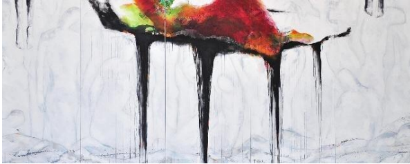
شكل (٩) الفنانة سهيلة حسين النجدي ، من مجموعة الكرسي، مواد مختلطة على كانفس، ٢٠١٧، ٢ x ٥٥