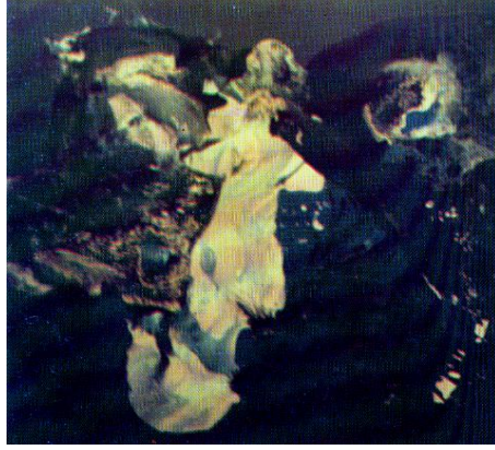
شكل (١٣) فواد كامل - لوحة تجريدية ١٩٥٨