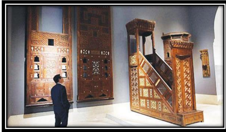
شكل (17): متحف الفن الإسلامي بالقاهرة

المملكة كدولة إسلامية أولى بأن تضم متحف للفنون الإسلامية، خاصة بوجود الحرمين الشريفين، ومسجد قباء. والكثير من آثار الصحابة والتابعين، والخلافات الإسلامية. ولنا قدوة في متحف الفن الإسلامي بالقاهرة حيث يعد أكبر متحف إسلامي بالعالم فقد ضم مجموعات متنوعة من الفنون الإسلامية من الهند والصين وإيران مروراً بفنون الجزيرة العربية والشام ومصر وشمال أفريقيا والأندلس.