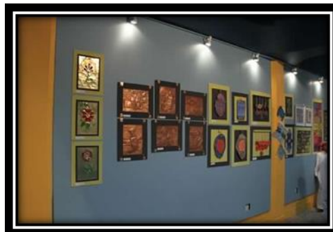
شكل (1): معرض للتربية الفنية