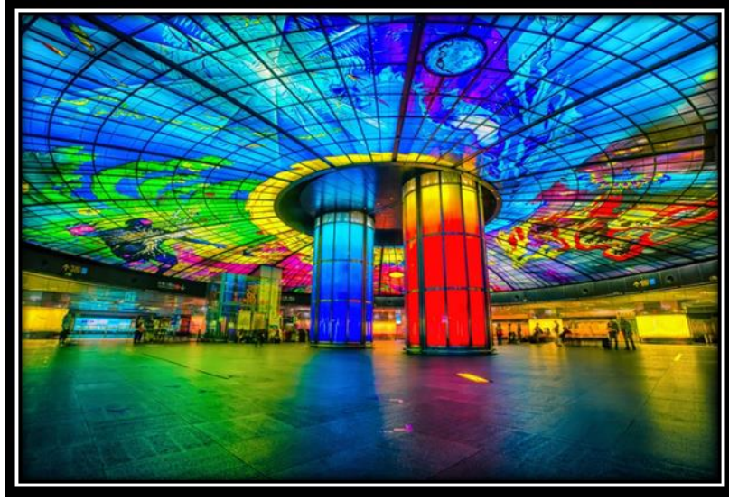
شكل (22): قبة النور، محطة قطار تايوان، 2018.

3. قبة النور، في تايوان: تعد قبة النور أكبر منشأة فنية عامة في العالم مصنوعة من قطع فردية من الزجاج الملون. استغرقت قبة النور العمل لمدة أربع سنوات.