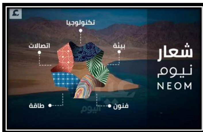
شكل (14): شعار مشروع نيوم.