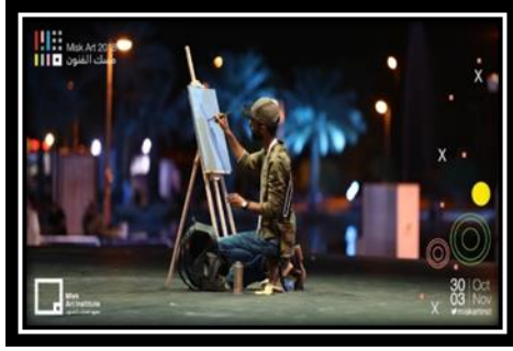
شكل (4): لوحات مبتكرة بأيدي فنانين سعوديين في معرض الجاليري السعودي ضمن مسك للفنون.