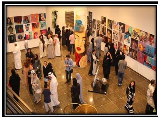
شكل (7): أحد معارض أجنحة عربية للفنون الجميلة

تأسست الفن جميل في عام 2003 كجزء من مجتمع جميل، لمواصلة مسيرة عائلة جميل في دعم المجتمع التي بدأ في الثلاثينات من قبل الراحل عبد اللطيف جميل، مؤسس شركات عبداللطيف جميل، حيث ساعد على مدار حياته عشرات الآلاف في مجالات الرعاية الصحية، والتعليم، وتحسين مستوى المعيشة. واليوم، تركز مجتمع جميل جهودها لدعم الاستدامة الاجتماعية والاقتصادية في جميع أنحاء منطقة الشرق الأوسط من خلال مجموعة من المبادرات المتنوعة. فن جميل افتتحت فن جميل يوم 11 نوفمبر 2018 مركز جميل للفنون، والذي يعد مؤسسة عصرية مبتكرة مقرها دبي، الإمارات العربية المتحدة؛ وفي 2020، تستعد فن جميل لافتتاح "حي: ملتقى الإبداع" في جدة، المملكة العربية السعودية والذي سيكون مركزاً رئيسياً للأعمال الإبداعية في السعودية. شكلي (9،10).