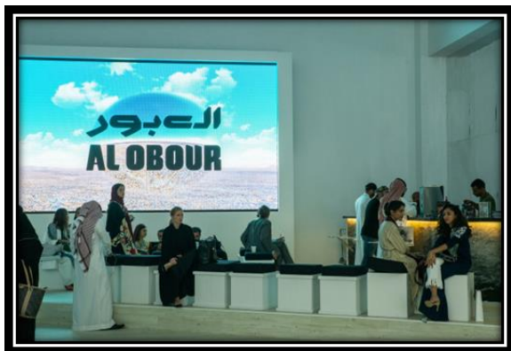
شكل (8): جانب من معرض العبور.1

بجدة، لافتةً إلى أن الدورة الحالية للمعرض ستستخدم للمرة الأولى الإنسان الآلي للتفاعل مع الجمهور، إضافة إلى تسخير التقنية الحديثة في إيجاد تجربة تفاعلية مع المعارضات الفنية مستوحاة وتصب في مفهوم العبور. شكل (8).