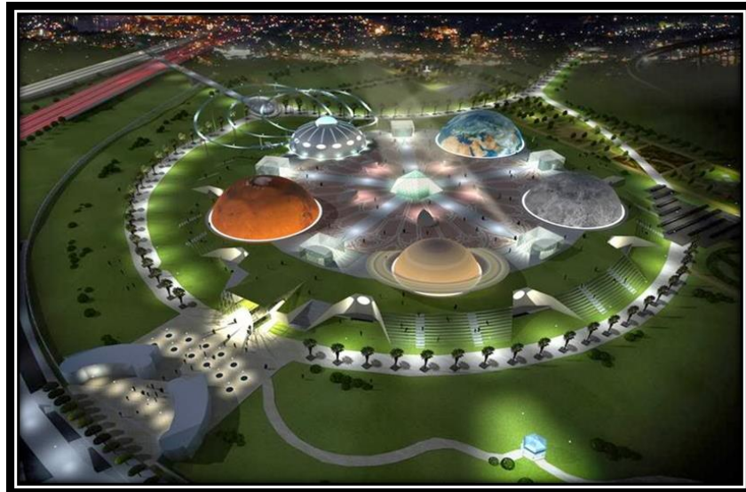
شكل (21): بعض المشاهد لحديقة زعبيل. دبي، 2006.