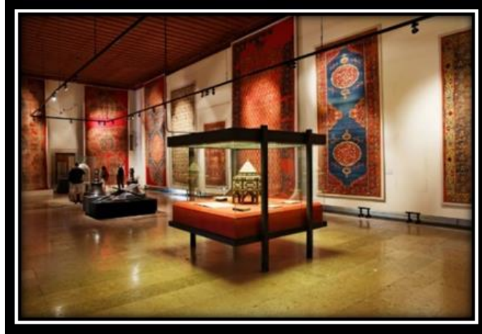
شكل (15): متحف السجاد في اسطنبول.

والجدير بالذكر أن متحف السجاد بتركيا عبارة عن مبنى صغير تم بناؤه بالتزامن مع مسجد السلطان أحمد بين 1609-1617. يضم طابقين بهما مجموعة متنوعة من السجاد والبسط من القرنين الرابع عشر والتاسع عشر. ويحتوي على قطع فريدة من السجاد والسجاد العثماني القديم. وقد تم إنشاء مجموعة المتحف من خلال جمع السجاد التاريخي والجدير بالفن الذي تم التبرع به للمساجد لعدة قرون من قبل التقاليد الإسلامية القديمة.