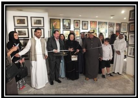
شكل (10): معرض لوحة في كل بيت التاسع.

تأسست الفن جميل في عام 2003 كجزء من مجتمع جميل، لمواصلة مسيرة عائلة جميل في دعم المجتمع التي بدأ في الثلاثينات من قبل الراحل عبد اللطيف جميل، مؤسس شركات عبداللطيف جميل، حيث ساعد على مدار حياته عشرات الآلاف في مجالات الرعاية الصحية، والتعليم، وتحسين مستوى المعيشة. واليوم، تركز مجتمع جميل جهودها لدعم الاستدامة الاجتماعية والاقتصادية في جميع أنحاء منطقة الشرق الأوسط من خلال مجموعة من المبادرات المتنوعة. فن جميل افتتحت فن جميل يوم 11 نوفمبر 2018 مركز جميل للفنون، والذي يعد مؤسسة عصرية مبتكرة مقرها دبي، الإمارات العربية المتحدة؛ وفي 2020، تستعد فن جميل لافتتاح "حي: ملتقى الإبداع" في جدة، المملكة العربية السعودية والذي سيكون مركزاً رئيسياً للأعمال الإبداعية في السعودية. شكلي (9،10).