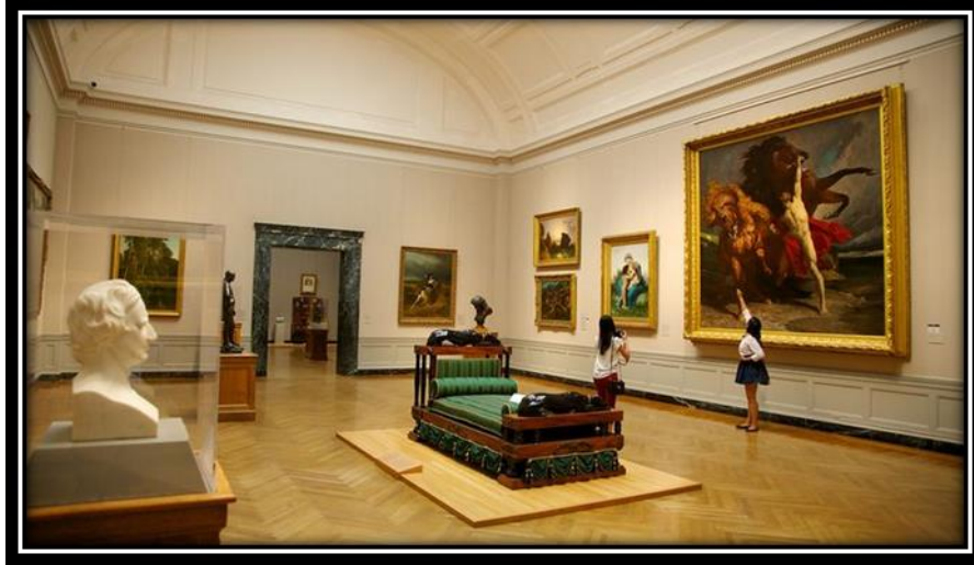
شكل (18): متحف الفنون الجميلة في بوسطن بأمريكا