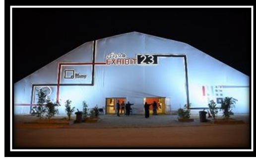
شكل (3): أحد المعارض التي أشرفت عليها مؤسسة مسك.

❖ وعطفاً على مبادرات مسك الفنون ٢٠١٨ ، درّة الرياض ، المملكة العربية السعودية ، ٣٠ أكتوبر - ٣ نوفمبر ٢٠١٨ حالياً تبنت جهات حكومية أسبوع الفن في جدة منذ عام 2010م وحتى الآن ومعرض فن وهي مبادرة غير ربحية من المجلس الفني السعودي تشمل على العديد من المعارض الفنية والثقافية والاجتماعية في مختلف أنحاء مدينة جدة، تتضمن معارض فنية متنوعة لشباب سعوديين بأساليب ومدارس مختلفة من الفن التشكيلي المعاصر والأسلوب المفاهيمي، (شكلي 5،6).