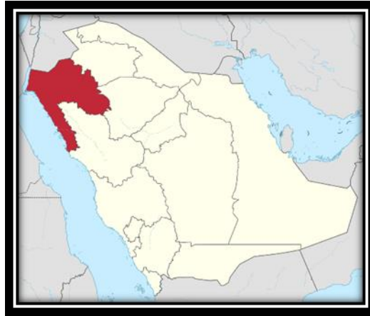
شكل (11): حدود منطقة تبوك.

منطقة تبوك تعد واحدة من مناطق السعودية وتقع في شمال غرب المملكة العربية السعودية، تحدها المملكة الأردنية الهاشمية من الشمال ومن الشرق منطقة الجوف ومنطقة حائل. ومن الجنوب منطقة المدينة المنورة ومن الغرب خليج العقبة والبحر الأحمر. شكل (1)، وتعد المنطقة ذات موقع جغرافي متميز بحكم إطلالتها من جهة الغرب على البحر الأحمر وخليج العقبة بشواطئ بحرية طويلة. وقد ساعد ذلك الموقع في نشوء عدد من الموانئ الصغيرة والمتمثلة في أمّج و ضباء و الوجه. كما أن لمنطقة تبوك حدوداً مع الأردن ويربط بينهما طريق أسفلتي دولي يصل ميناء العقبة الأردني بمدينة تبوك مروراً بمدينة حقل وصولاً إلى المدينة المنورة. بالإضافة إلى الطريق الذي يربط عمان بتبوك مروراً بمعان ثم حالة عمار. وأهم مدن المنطقة هي الوجه، ضباء، أمّج، حقل تيماء، البدع، حالة عمار. شكل (11).