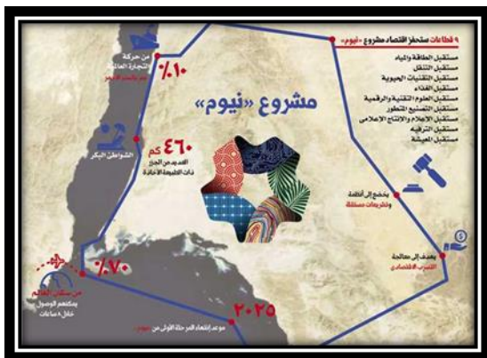
شكل (13): قطاعات مشروع نيوم.

أنه يقدم المشروع مزايا قيمة للشركات والأفراد؛ بحيث يلبي احتياجات المملكة العربية السعودية، ويستقطب أفضل الشركات وأصحاب الكفاءات من جميع أنحاء العالم. وهي منطقة تطوير حافلة بالفرص، ويتمتع هذا المشروع بعدد من المزايا الفريدة.