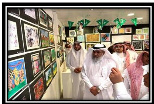
شكل (2): معرض للتربية الفنية

البدايات الأولى للتربية الفنية في التعليم بالمملكة كانت عام 1326 هـ عندما أدخلت مادة الرسم ضمن الخطة الدراسية في المدرسة الخيرية العارفية بمكة المكرمة أعقب ذلك بفترة إدخال مادة الحرف التقليدية في مدارس العلوم الشرعية بالمدينة المنورة عام 1340 هـ. كما أدخلت مادة الرسم في المدارس التحضيرية بمكة المكرمة عام 1349 هـ، عندما افتتح الملك سعود بن عبد العزيز رحمة الله عليه أول معرض فني لمدارس المملكة في مدينة الرياض عام 1378 هـ. أعقبه العام الذي يليه مباشرة 1329 هـ المعرض الثاني والذي افتتحه وزير المعارض حين ذاك خادم الحرمين الشريفين الملك فهد بن عبد العزيز يرحمه الله. شكلي (1، 2).