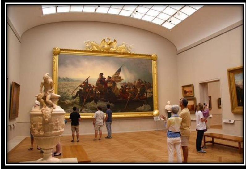
شكل (16): متحف المتروبوليتان

ولم يقتصر على الأعمال الفنية وإنما شمل عرض آلات موسيقية وعسكرية وأثاث قديم إضافة إلى جناح خاص بتطور الأزياء حتى العصر الحديث. وتميز متحف المتروبوليتان بحيازته على مجموعة كبيرة من الفن المصري والآشوري القديم غير أنه يتفاخر بأكبر مجموعة لديه من الفن الإسلامي .