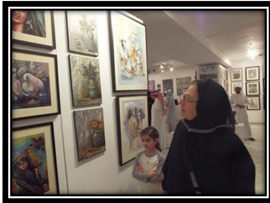
شكل (6): جانب من حضور الجماهير لأسبوع الفن في جدة.

❖ وعطفاً على مبادرات مسك الفنون ٢٠١٨ ، درّة الرياض ، المملكة العربية السعودية ، ٣٠ أكتوبر - ٣ نوفمبر ٢٠١٨ حالياً تبنت جهات حكومية أسبوع الفن في جدة منذ عام 2010م وحتى الآن ومعرض فن وهي مبادرة غير ربحية من المجلس الفني السعودي تشمل على العديد من المعارض الفنية والثقافية والاجتماعية في مختلف أنحاء مدينة جدة، تتضمن معارض فنية متنوعة لشباب سعوديين بأساليب ومدارس مختلفة من الفن التشكيلي المعاصر والأسلوب المفاهيمي، (شكلي 5،6).