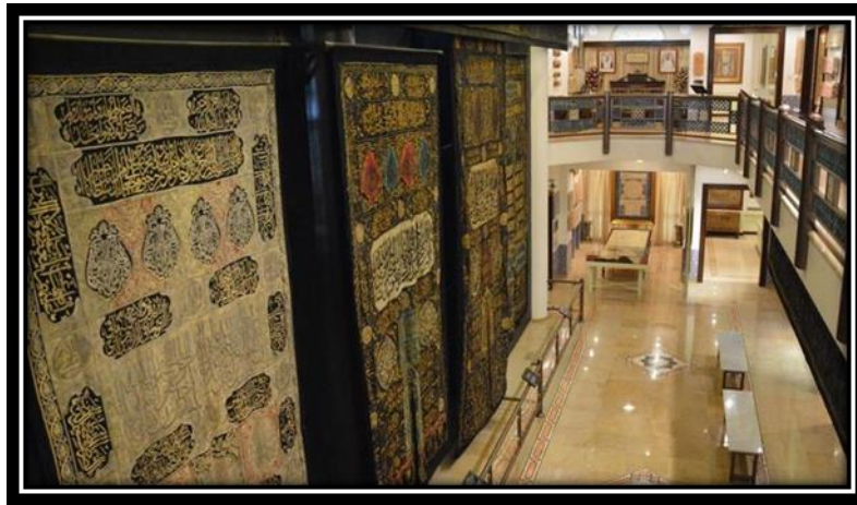
شكل (19): متحف الخط الاسلامي في الكويت

المتحف يغطي فترات تبدأ من العصر الاسلامي الى العصر الحديث لفنون الخط الاسلامي والزخرفة في جميع اقطار العالم الاسلامي من خلال من شاركوا بلوحاتهم وابداعاتهم الفنية خلال هذه العقود من الزمن، وقاموا بخط منتجاتهم على الورق والجلد والخشب والنحاس وغيرها من الخامات التي تضمنت الآيات القرآنية والاحاديث.