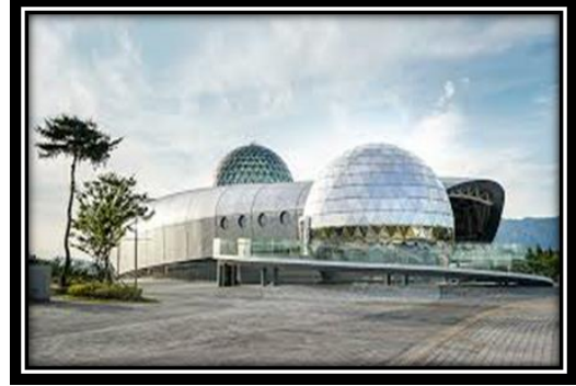
شكل (20): Space 360، Gwangju، South Korea، 2017.