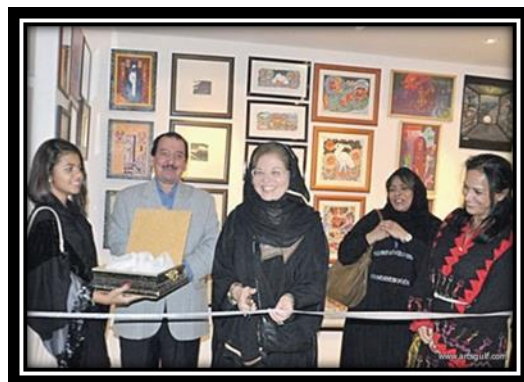
شكل (9): أحد معارض لوحة في كل بيت الخامس

1. جدة 03 جمادى الآخرة 1440 هـ الموافق 08 فبراير 2019 م، افتتحت بجدة أعمال معرض الفن المعاصر "العبور"، الذي ينظمه المجلس الفني السعودي للعام السادس على التوالي، بمشاركة 25 فناناً سعودياً وخليجياً وأوروبياً، وسط حضور لافت من الفنانين، والمهتمين، والإعلاميين، والشركات الراعية.