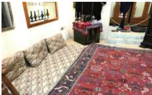
شكل (25) المطارح

عبارة عن جلسة أرضية من وسائد وسجاد. (الخرس والعروقة، صفحة 144)