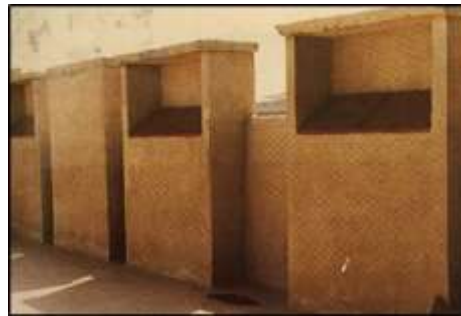
شكل (5) الباجدير