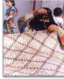
شكل (30) الحصير