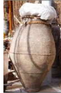
شكل (31) الحب