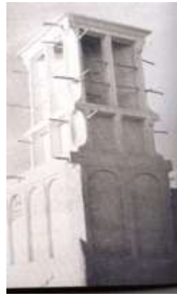
شكل (15) البارجيل