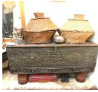
شكل (16) صندوق المبيت