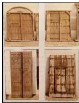
شكل (10) الأبواب القديمة