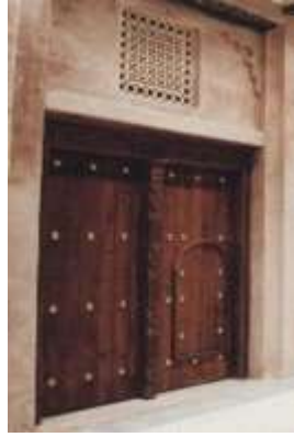
شكل (13) الأبواب بالبيت الإماراتي القديم