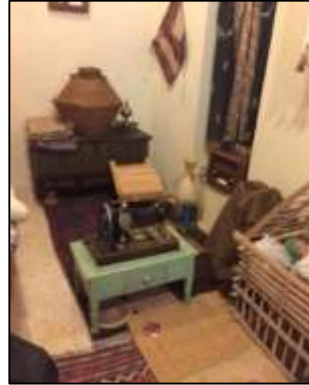
شكل (18) يوضح سلة الروط