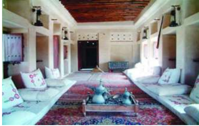
شكل (12) المجلس بالمنزل الإماراتي القديم

أو قد تطل على الحوش الذي أمامه وقد عزل المجلس تماما عن داخل المنزل إلا من باب صغير خصص لخدمة الضيوف بلوازم الضيافة كالطعام والشراب وغير ذلك. أما ظهر المجلس فقد كان يواجه البيت من أجل الخصوصية التامة للنساء الموجودات في هذا البيت بل كان يبني أحيانا جدار فاصل بين المجلس وبين البيت حيث يوجد باب من أجل إدخال "الفوالة" أو أي أمور أخرى خصوصا أثناء الدعوات للغذاء أو العشاء أو غيرها من المناسبات، وقد زينت جدران المجلس خصوصا فوق النوافذ بزخارف نباتية منحوتة فوق الجبس. كما يتميز المجلس بالرحابة فهو يتسع لعدد كبير من الضيوف ويتبادل الحضور الحديث.