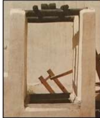
شكل (7) الجليب