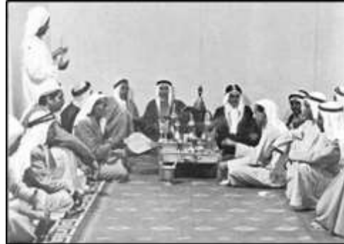
شكل (3) الديوان (الديوانية)