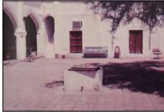
شكل (2) الحوش والليوان بالمسكن الكويتي القديم

3. الحوش: يعد الحوش القاسم المشترك في بناء وتشكيل البيوت التقليدية إذ لا يخلو منه أي منزل وتطل عليه أغلب الغرف كما يعتبر المتنفس لكل مرافق المسكن من غرف معيشة وغرف خدمات وليوانات، وتفتح جميع الأبواب والنوافذ (الشبابيك) على الحوش، ماعدا الفتحات الخاصة بمجلس الضيوف، فهي تطل على الخارج (السكيك) ذلك لان الحوش هو خاص بالأسرة وأفراد المنزل، كما انه مفتوح على الفضاء الخارجي ويوفر الانارة الطبيعية لجميع غرف المنزل ومرافقه، كما يوفر التهوية اللازمة لأقسام المنزل ويجعل أجواءها صحية بالقدر المطلوب، كما يتميز باتساعه ورحابته فهو حديقة المنزل وتزرع فيه أشجار النخيل واللوز والسدر، وهو مكان مناسب للهو الأطفال ولعبيهم في الكويت يوجد عدة أقسام للحوش منها : حوش الديوانية له باب خارجي على الشارع مباشرة، و حوش الغنم والماشية والدواجن ، وحوش الحرم . "ويتراوح شكل الحوش عموماً ما بين المربع والمستطيل. ويقع الحوش عادة في الجزء الأوسط من البناء أو في ركن من الأركان. (الغنيم، صفحة 228)