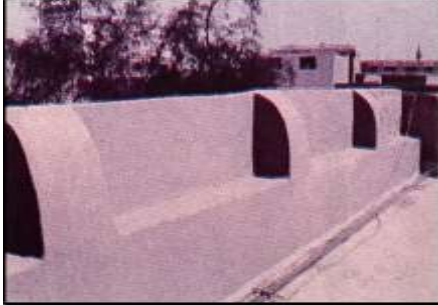
شكل (8) إحجا

هو القليب او البئر، ويحرص صاحب البيت على وجوده في أحد الاحواش ولا سيما حوش المطبخ، وماء الجليب مالح لا يصلح للشرب ويستخدم من أجل النظافة والطهارة وتبريد بعض الفواكه. (الغنيم، صفحة 534)