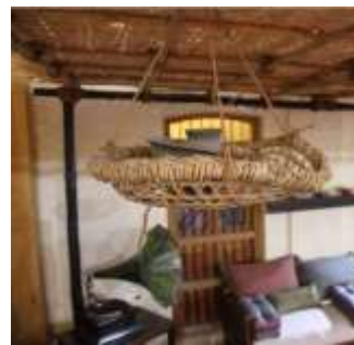
شكل (24) الملاله