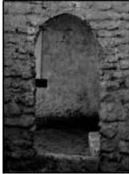
شكل (4) الفرية

وهو قسم مخصص للرجال يسمى باسم العائلة وليس باسم كبيرهم . ولكل قسم مدخلة الخاص به ويوجد بينهم ممر يسمى "مدربان" كما توجد فتحة بين القسمين وتسمى " النقبة " وتعرف أيضا " بالفرية " وهي عبارة عن فتحة بالحائط تسمح بالاتصال ما بين القسمين دون الدخول إضافة على ذلك يوجد أيضا في بيوت الأغنياء مجلس مخصص للرجال فقط وتكون ملحقة في البيت وأثاثها وحجمها حسب إمكانيات و مكانة وشخصية صاحبها وتكون في الغالب في منازل الأثرياء أو المقتدرين ولم تكن الدواوين بالكثرة قديما كما هو في الوقت الحالي حيث ليس بمقدور الكثير تحمل نفقاتها إلا الشخص المقتدر وللدواوين اثرها الكبير في ترابط الأسر الكويتية قديما وروادها هم من التجار ورجال العلم والمثقفين والعامه وتقام بها الاحتفالات بالمناسبات كالأعياد وشهر رمضان وكذلك الأعراس الخاصة بالعائلة نفسها أو أقربائهم أو جيرانهم.