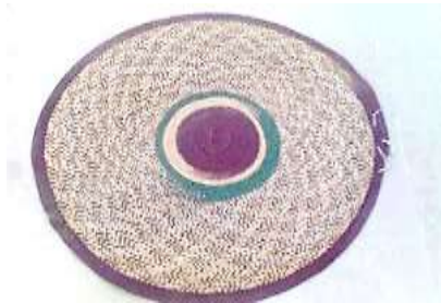
شكل (29) السفرة

كانت المرأة الإماراتية تحتفظ بملابسها في سلة الخوص ذات ألوان زاهية الأخضر الأحمر بالإضافة الى لون الخوص الذي يشبه لون رمل الصحراء وتكون السلة من قطعة كبيرة عميقة وغطاء للمحافظة على الملابس من الاتربة، اما عليه القوم فكانوا يستخدمون لحفظ ملابسهم صندوقاً من الخشب يسمى المندوس يستورد من الهند ويحلى من الخارج بالمعادن التي تكسبه الطابع التراثي البديع.