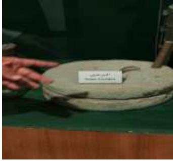
شكل (27) الرحي

ويصنع من الفخار ومخروطي الشكل يستخدم لتبريد الماء. (جريدة العرب، الأربعاء 2016/2/10)