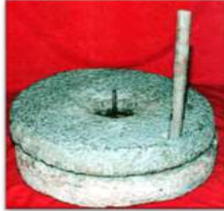
شكل (32) الرحى

ويصنع من الفخار ومخروطي الشكل يستخدم لتبريد الماء.