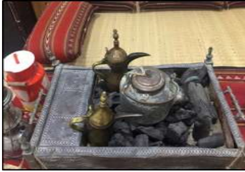
شكل (23) الدوة

يوضع عليها (المبخر - المرش - المكحلة - المشط - المفرق)