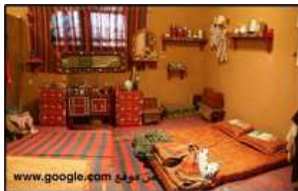
شكل (21) الدوشق

مفرش الطعام ومصنوع من الخوص وعادة كبيرة الحجم ومستديرة الشكل (جريدة العرب، الأربعاء 2016/2/10)