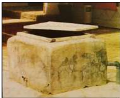
شكل (6) البركة

8. البركة: هي حفرة مستديرة أو مربعة يتراوح عمقها بين ثلاثة وأربعة أمتار تحفر في حوش المنزل لحفظ المياه العذبة.