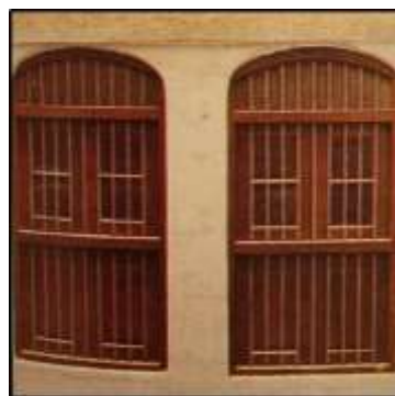
شكل (9) النوافذ القديمة