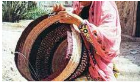
شكل (28) سلة حفظ الملابس