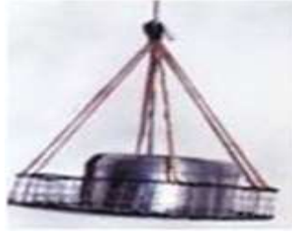
شكل (31) الملاله