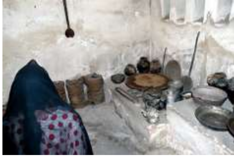
شكل (16) يوضح المطبخ

وهو البناء الذي يطل على الخارج من فوق السطح بمقدار 3 أمتار بل أكثر، ويمتد إلى داخل إحدى الغرف، أما طول البارجيل داخل البيت فهو يصل إلى قامة الرجل ومهمته هي جلب الهواء إلى داخل الغرفة التي يوضع فيها ويسمى "ملقف الهواء" أما الأجناب فيسمونه "الأبراج الهوائية" لأنه يمثل أعلى نقطة في البيت، والهواء من الخارج يصطدم بفتحاته الأربع المتصلة بداخل الغرفة ويتم من خلالها دخول الهواء بارداً منعشاً، وتستخدم الغرفة التي فيها البارجيل للنوم وتناول الوجبات ثم الجلوس والسوالف. (العاصي، صفحة 21)