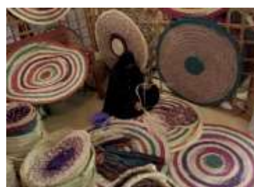
شكل (20) السفرة