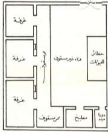
شكل (1) تقسيم فراغات المسكن الكويتي القديم

3. الحوش: يعد الحوش القاسم المشترك في بناء وتشكيل البيوت التقليدية إذ لا يخلو منه أي منزل وتطل عليه أغلب الغرف كما يعتبر المتنفس لكل مرافق المسكن من غرف معيشة وغرف خدمات وليوانات، وتفتح جميع الأبواب والنوافذ (الشبابيك) على الحوش، ماعدا الفتحات الخاصة بمجلس الضيوف، فهي تطل على الخارج (السكيك) ذلك لان الحوش هو خاص بالأسرة وأفراد المنزل، كما انه مفتوح على الفضاء الخارجي ويوفر الانارة الطبيعية لجميع غرف المنزل ومرافقه، كما يوفر التهوية اللازمة لأقسام المنزل ويجعل أجواءها صحية بالقدر المطلوب، كما يتميز باتساعه ورحابته فهو حديقة المنزل وتزرع فيه أشجار النخيل واللوز والسدر، وهو مكان مناسب للهو الأطفال ولعبيهم في الكويت يوجد عدة أقسام للحوش منها : حوش الديوانية له باب خارجي على الشارع مباشرة، و حوش الغنم والماشية والدواجن ، وحوش الحرم . "ويتراوح شكل الحوش عموماً ما بين المربع والمستطيل. ويقع الحوش عادة في الجزء الأوسط من البناء أو في ركن من الأركان. (الغنيم، صفحة 228)