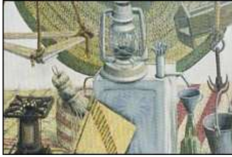
شكل (17) الحصير