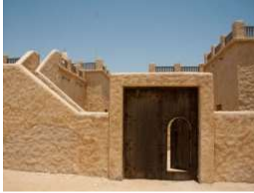
شكل (11) بيت الطين

يغلب على المسكن الإماراتي الذوق الرفي وتتنم عمليات تصميم المباني في أغلب الأحيان بطريقة اجتهادية عن طريق مالك قطعة الأرض أو عن طريق صغار المقاولين الذين يسيطرون على أعمال البناء في هذه المناطق فيقوم المقاول بأعمال التصميم والتنفيذ