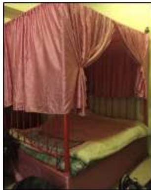
شكل (19) كرفاية (السريير)

بغطاء منسوجة من شرائط الاسل اغصان العنب أو الرمان، تألف من قسمين أحدهما بمثابة الوعاء توضع فيه الثياب والآخر يعلو الاول ويكون له غطاء ويكاد القسمان يتساويان في شكلهما عدا بعض الفروق البسيطة، فمن ذلك ان الغطاء تعلوه دائرة قطرها 25 سم، وارتفاعها 20 سم. من المادة التي صنعت منها السلة وذلك لتسهيل مسك الغطاء وتحريكه. ولم يكن البيت الكويتي القديم يخلو من هذه السلال التي كانت النساء يستخدمنها لحفظ الملابس والاشياء الاخرى. وكان توضع فوق الصندوق المبيت حتى عدت كأنها جزء مكمل له. (الخرس والعقروقة، صفحة 153)