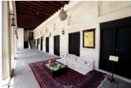
شكل (14) الإيوان

"الليوان" وهو المنطقة المسقوفة المستطيلة الشكل التي تواجه الغرف مباشرة وتوجد في الإيوان عدة أعمدة وسقفه يكون متصلاً بهذه الأعمدة وسقف الغرف، والإيوان ليس عريضاً حيث أن له عدة مهام مثل حفظ الغرف من دخول أشعة الشمس الحارقة مباشرة إليها، وحفظها من دخول الأتربة، كما يستخدم الإيوان مجلساً للنساء وللمقربين من الأهل. (البيان عبر الإمارات، 2014)