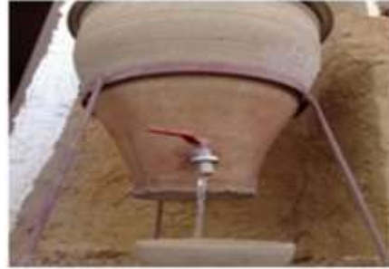
شكل (26) الحب