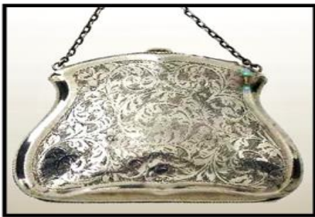
شكل (٦) حقيبة مصنوعة من المعدن، للفنان تشيستر T&S ، ترجع لعام ١٩١٩ من فن آرت ديكو نقلاً عن (15)