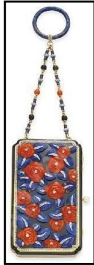
شكل (٩) حقيبة مستحضرات تجميل صغيرة الفن الزخرفي Art Deco ، للفنان سوثيربي's sotheby's المكان : سانت مورتييز (جنوب شرق سويسرا) نقلًا عن (17)