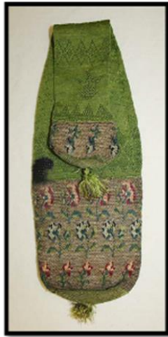
شكل (٤) حقيبة ترجع إلى أوائل القرن الثامن عشر، من بريطانيا مكان الحفظ: متحف ميتروبوليتان رقم الحفظ / التسجيل: ١٤٩٠٥ . ١٩٧٦ نقلاً عن (22)