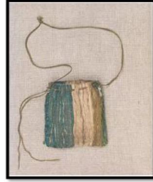
شكل (١) كيس نقود مصنوع من القماش يرجع إلى القرن الثالث عشر نقلاً عن (24)