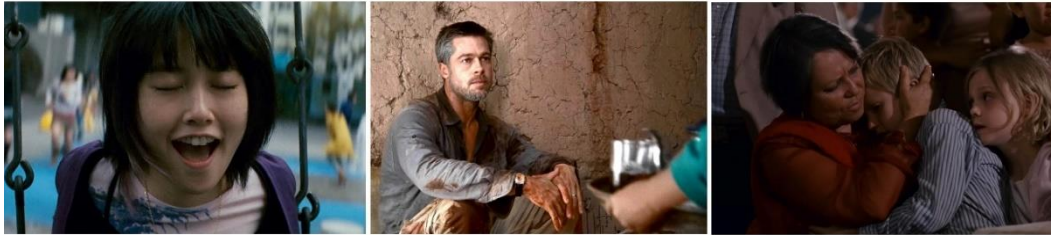
شكل (4) فيلم (بابل)، من اليمين لليسار: المشاهد المصورة في (المكسيك - المغرب - اليابان) بوسائط فيلمية مختلفة

عن محاولات البطل للسيطرة على عالمه، وفيما بعد ينتقل الفيلم إلى نسبة (2.40:1) ليُعبّر عن كادر أوسع وأفق أكثر رحابة. كما استخدم العدسات "الأنامورفية" في مشاهد محددة لتعزل البطل عن ما حوله. (Benjamin 2011) وكان "بريتو" قد استخدم ذلك المزج مسبقاً مع نفس المخرج في فيلمهما السابق "بابل" (Babel) في 2006 حيث صورت المشاهد التي تحدث في المكسيك بكاميرا "سوبر 35مم" ومشاهد المغرب بكاميرا "16مم" للحصول على حبيبات صورة أكبر، والمشاهد التي تحدث في اليابان بعدسات "أنامورفية" (Anamorphic). ليعطي كل جزء في القصة طابعاً خاصاً مختلفاً، ويرتبط بالحالة العامة لقصة الفيلم، شكل (4).