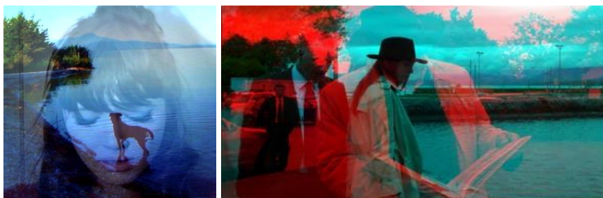
شكل (3) التجريب باستخدام العرض ثلاثي الأبعاد، (وداعاً إلى اللغة) - 2014

وفي عام 2014 قدم "جان لوك جودار" ** البالغ من العمر 83 عاماً فيلمه "وداعاً إلى اللغة"*** واستخدم فيه تقنيات الأبعاد الثلاثية بشكل تجريبي فريد، شكل (3)، وقام مع مدير تصويره بإجراء تجارب عديدة للوصول إلى أشكال فنية مبتكرة، تكسر القواعد التقليدية لاستخدام التصوير والعرض ثلاثي الأبعاد، وفي بعض الأحيان تسخر من تحول الأفلام لهذه التقنية. فذهب "جودار" في فيلمه إلى تحليل وتفكيك استخدام هذه التقنية الجديدة كوسيط عرض سينمائي، وأعلن في لقاءات صحفية لاحقة للفيلم، أن رغبته الأساسية كانت خوض ذلك العالم الجديد، الممتليء بقواعد لم يتم اختبارها أو كسرها وتعديلها بعد. وحاز الفيلم على الجائزة الكبرى (Grand Prix) في مهرجان كان في نفس العام. (Bradshaw 2017)