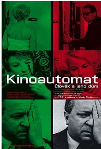
شكل (8) المصنق الدعائي لأول فيلم تفاعلي

تعتبر السينما التفاعلية عن الصراع الدائم بين أهداف الفنان وحدود إمكانيات التكنولوجيا المتاحة، فلم التفاعلية (Interactivity) بين المشاهد والفيلم السينمائي راود الكثير من صناعات السينما على مدار السنوات، كوسيلة إبداعية لإشراك المشاهد في التجربة السينمائية وتوريطه في اتخاذ القرار، وفي 1967 قدم فيلم (Kinoautomat) في أكبر معارض "مونتريال" باعتباره أول فيلم تفاعلي، شكل (8)، وكان الأسلوب المتبع هو أنه عند كل مفترق طريق في القصة يتوقف الفيلم ويظهر منسق العرض ليخبر الجمهور بين احتمالين، ويأخذ تصويت الجمهور وبناء على النتيجة يعرض المشاهد المختارة حتى النقطة التالية، وهكذا. (Willoughby 2007)