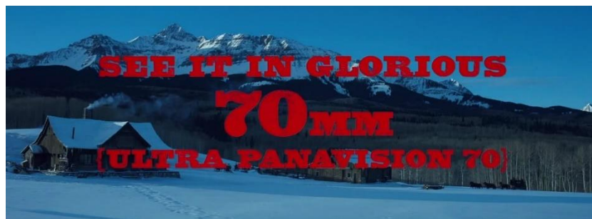
شكل (5) إعلان فيلم (The Hateful Eight) (2015) وتتضح نسبة العرض غير الشائعة حالياً

وتعتبر من الممارسات الشائعة في مرحلة ما بعد الإنتاج (Post-production) للأفلام المصورة رقمياً، أن يقوم مصحح الألوان بإضافة بعض المؤثرات الخاصة لمحاكاة تأثير الخام السينمائي وجعل الصورة أكثر "فيلمية". مثل إضافة الحبيبات (Film grains) ، أو التلاعب في نسبة التباين، أو حتى إضافة بعض عيوب العدسات بشكل رقمي، وعلى العكس، يعتز بعض صناع السينما الآخرون بجماليات الصورة الرقمية وخلوها من أية عيوب أو شوائب أو حبيبات، ويرون أن الرغبة في تحويل الصورة الرقمية لتبدو كالصورة الفلمية، هي رغبة سببها الأساسي الاعتياد على جماليات الصورة الفلمية طيلة القرن الماضي. ولكن في العصر الحالي سيعتاد المتفرج على الشكل المختلف للصورة، وربما سيراه أكثر جمالاً فيما بعد.