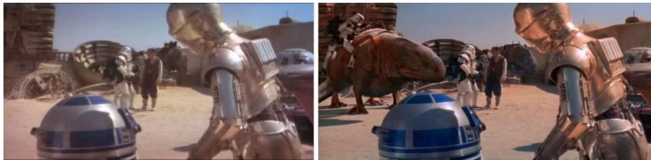
شكل (1) فيلم (حروب النجم)، إلى اليسار النسخة الأصلية (1977) وإلى اليمين نسخة (2011) أضيف فيها كائنات مصنعة بالكمبيوتر (CGI) في الخلفية، وتحديث جودة الصورة

ويقدم المخرج الأمريكي "جورج لوكاس" (George Lucas) من خلال تعامله مع فيلمه الأشهر "حروب النجم" (Star Wars) الذي صدر في 1977، مثلاً شهيراً في معاملة الفيلم معاملة البرمجيات بشكل مباشر، حيث أعد نسخاً مختلفة على مدار السنوات اللاحقة، وفي كل مرة كان يضيف أو يحذف شيئاً من الفيلم الأصلي ليخرج بالنسخة المعدلة. حيث تم تعديل عنوان الفيلم عند صدور الجزء الثاني منه في 1980، وصدرت نسخ لاحقة تحتوي على مؤثرات خاصة جرافيكية تتناسب مع العصر الحديث، كما يظهر في شكل (1).