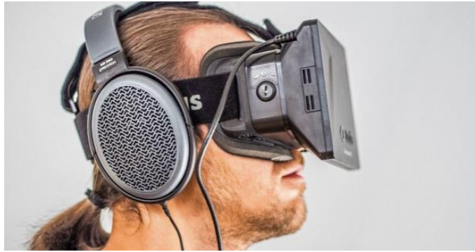
شكل (9) أدوات عرض أفلام الواقع الافتراضي (VR)

إلا أن هذه التخوفات لا تمنع الاستخدام المتزايد لسينما الواقع الافتراضي، فقد بدأت بعض المهرجانات الفنية الهامة مثل "ساندانس" و"ترايبیکا" في الاحتفاء بأفلام قصيرة صممت باستخدام الواقع الافتراضي، حيث يرتدي المشاهد نظارة رأس وسماعات خاصة، لينغمس كلياً في العالم البصري والسمعي للفيلم. وتحتوي تلك النظارة على مجسات تستشعر حركة الجسم، فيمكن للمشاهد كذلك أن يستدير بجسمه ورأسه ليتأمل البيئة الفيلمية كلها، بحيث تكون كل لقطات الفيلم مصورة في 360 درجة كاملة، ويكون بإمكان المشاهد أن ينظر أينما يشاء، ويوضح شكل (9) أدوات عرض أفلام الواقع الافتراضي.