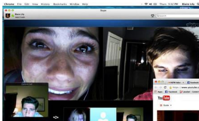
شكل (7) لقطة من فيلم (Unfriended) - 2014

اتخذت التطبيقات الإبداعية لتكنولوجيا تصوير الفيديو اتجاهاً آخر بانتشار الهواتف الذكية ذات الجودة العالية، وتسلسل ذلك الوسيط الحديث إلى المجال السينمائي، حيث قام المخرج الأمريكي "ستيفن سودربيرج" (Steven Soderbergh) الحائز على جائزة أوسكار والسعفة الذهبية بتصوير فيلمه الجديد (Unsane) باستخدام كاميرا "آيفون" (iPhone) بالكامل، ويجهز الفيلم للعرض في مهرجان برلين في 2018. بل أن المخرج أعلن كذلك أنه ينوى أن يصور جميع أفلامه القادمة باستخدام كاميرا الهاتف، ليفتح بذلك مجالاً تجريبياً جديداً في الصورة السينمائية. (Kohn 2018)