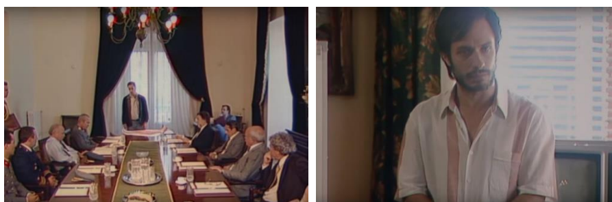
شكل (6) لقطات من فيلم (No) المصور بكاميرات تليفزيونية - 2012

ففي الفيلم الشيلي "لا" * المنتج في عام 2012، تدور الأحداث حول الاستفتاء الذي جرى في عام 1988 والتي أدت نتائجه لرفض الشعب استمرار الديكتاتور "بينوشيه" (Pinochet) في الحكم، ويتعرض الفيلم للحملة الإعلانية الشهيرة بعنوان (لا) الذي تعتبر السبب الأكبر في تغيير نتيجة التصويت. وتعتبر هذه الحملة المصورة تليفزيونياً بلقطاتها الشهيرة من الحملات الإعلانية الأيقونية في التاريخ، ولجأ مخرج الفيلم إلى التناص لإظهار الطبيعة الزمنية للفيلم الذي يدور في الثمانينيات، عن طريق تصوير الفيلم بأكمله على شرائط (U-Matic) و (Betacam) التليفزيونية، والتي كانت منتشرة في وقتها، والتي صورت بها الحملة نفسها. وأدى ذلك إلى تغيير الوسيط الفلمي نفسه ليحاكي روح الأحداث المعروضة، كما يظهر في شكل (6).