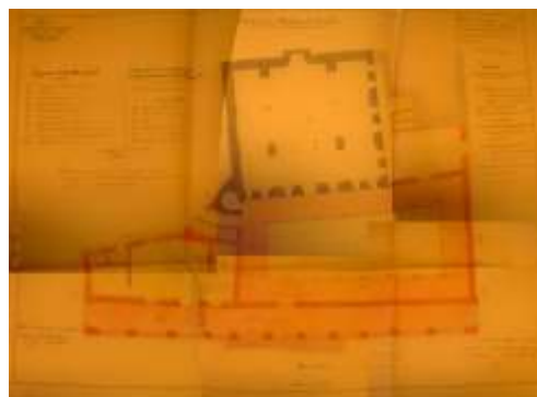
Fig n°02 : Plan de la mosquée du Bey portant les modifications à apporter.