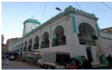
Photo n°05 : Djamâa Salah Bey à Annaba.

La couverture : se caractérise par la présence d'une seule coupole centrale disposée en avant du mihrab accompagnée de coupolettes hémisphériques (tradition ottomane).