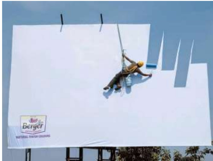
شكل رقم (3) 29 : إعلان outdoor لداهانات Berger

وفي كثير من الأحيان لا يعني مجرد وجود فكرة قوية الحملة, ضمان للحصول على إعلان جيد أو حملة إعلانية ناجحة, وذلك لأنه في كثير من الأحيان يمكن أن تضعف فكرة الحملة أثناء الترجمة من الفكرة إلى التنفيذ. 28