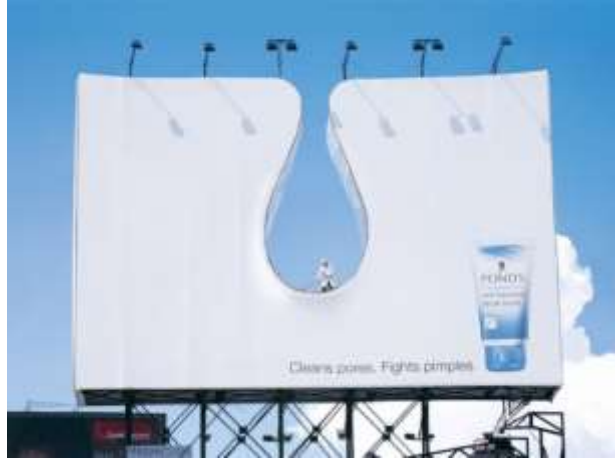
شكل رقم (4) 30 : إعلان outdoor لـ بوندز BOND'S

تقوم الفكرة الكبرى للإعلان على إظهار كيف أن هذا المنتج سوف يساعد حقا في التنظيف العميق للمسام, حيث حاول الإعلان أن يظهر قطع في مسام الجلد المصاب, وباستخدام المنتج سوف يتم القضاء نهائياً على الإصابة, وإعطاء البشرة مزيد من النضارة.