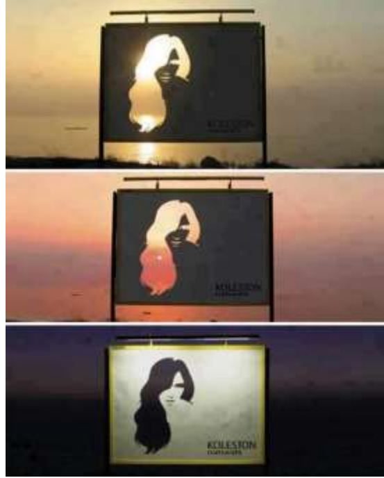
شكل رقم (5) 38 : إعلان Outdoor لصبغة كولستون, تعتمد الفكرة الكبرى للإعلان على استغلال الإضاءة الطبيعية في فترات النهار والليل المتتالية, وكأنها تظهر درجات لونية مختلفة من الصبغة .