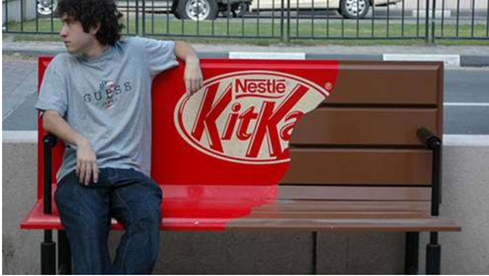
شكل رقم (2) 14 : إعلان لشيokolates كيت كات Kit Kat

أو العلامة التجارية والتي تساعد على المدى الطويل على تعزيز سمعة الشركة والاستثمارات طويلة الأجل، فالإعلان يهدف بشكل إبداعي إلى إقناع الجمهور والتأثير عليه باستخدام الطرق الإبداعية، ووسائل الإعلان المناسبة، والتكتيكات المقنعة، مما يدفع جمهور المستهلكين إلى تغيير المعتقدات والرغبات لديه تجاه المنتجات المعن عنها، وبالتالي يدفعه لاتخاذ رد فعل معين تجاه المنتج والإقبال على اتخاذ قرار الشراء. 13