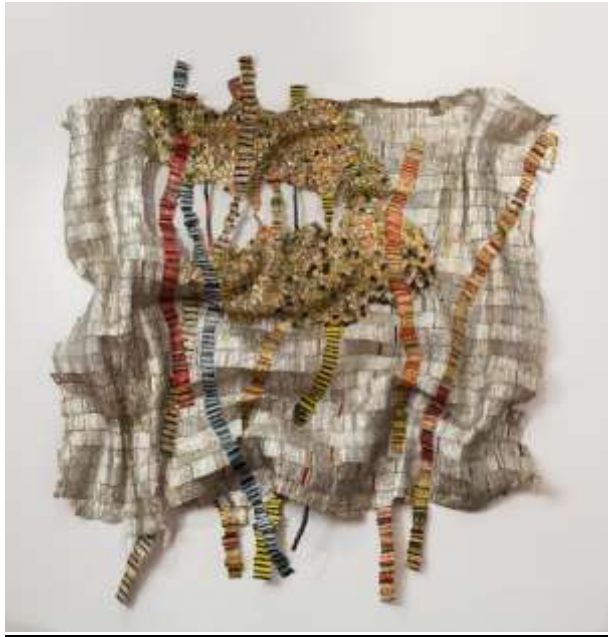
إل أناتسوي : العمل الثالث . شكل رقم ( 9 ) . الجذور المتوترة . 2014 . ( توليف من اقمشة - زجاج - بلاستيك - الومنيوم - اسلاك نحاسية - وخيوط )