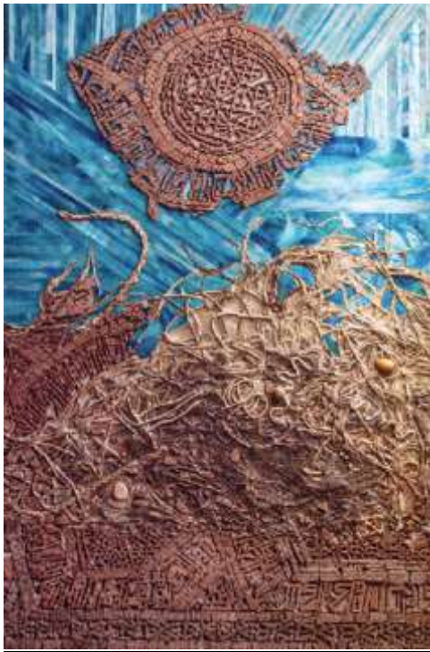
عبد السلام عيد : شكل رقم (1) استلهام التراث. 2017م ( توليف من خامات الحبال والكرتون والأوراق )

• الفنان المصرى عبد السلام عيد 1943م : احد الفنانين الذين تطرقوا للتوليف فى الفن بنهج من التجريب