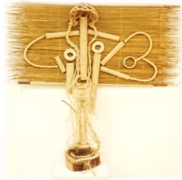
شكل رقم (16) . بدون عنوان . نبات السمار , البامبو . خشب , خيوط .

■ من هنا فان التوليف والتجريب يؤدي بالضرورة الى تطوير الاشغال الفنية والتحول بها نحو الحدائثة .