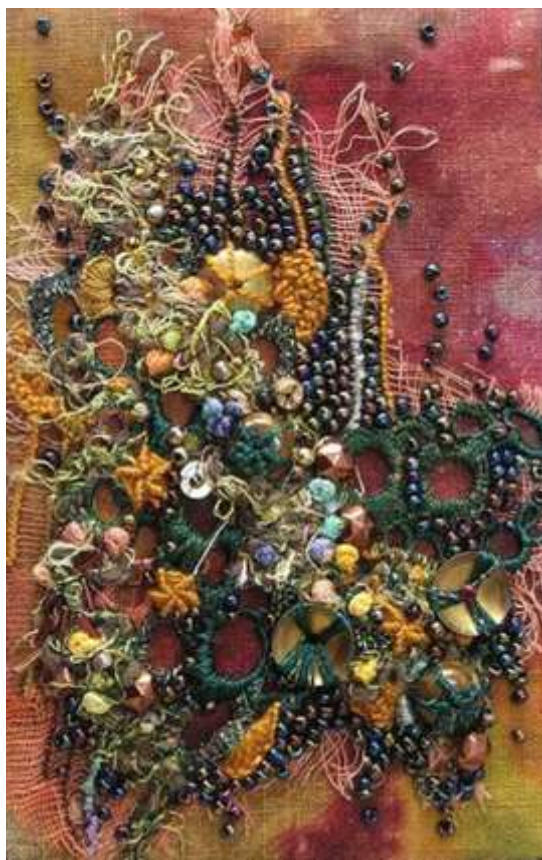
شارون بوجون: العمل الثانى . شكل رقم ( 8 ) . بطاقة بريدية. 2006. ( توليف من اقمشة - خيش - خرز - خيوط - خشب - صبغات )