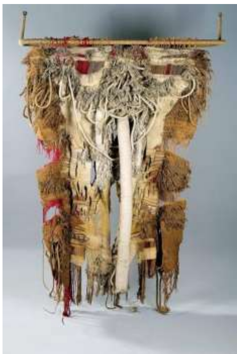
جوسيب جراو: العمل الخامس . شكل رقم ( 11 ) الغضب. 2011 م ( توليف من اقمشة – احبال – خيوط – خشب )