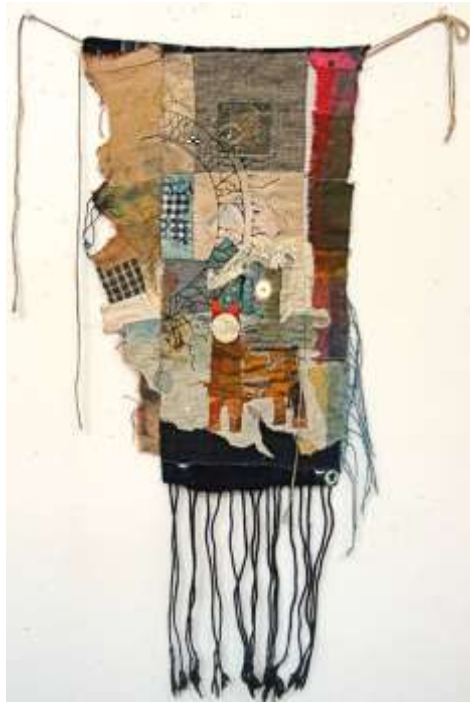
شكل رقم (12). بدون عنوان. العمل قوامه التوليف من اقمشة متنوعة من القطن، الكتان، الحرير، واحبال و خيوط و ازرار.

بين التجريب والحداثة ينطلق الابداع , فالتجريب يعد محور الحداثة فى الفن المعاصر , اذ يبعث على استحداث وابتكار صياغات تشكيلية جديدة بالتوليف والتركيب والتجميع او الاختزال او التجريد , ولما كانت الاشغال الفنية احد مجالات الفنون التشكيلية التى تبحث دائما عن الحداثة عن طريق ابداع رؤى تشكيلية خارجة عن المألوف , لذا فالتجريب يُعد ركيزة اساسية نحو استحداث معالجات تقنية غير تقليدية فى الاشغال الفنية , وتعتمد على التنوع فى بنيتها لانتاج رؤى ابداعية غير مألوفة , لكون التجريب يهدى الى التنوع فى الأساليب الفنية من جانب , وما يحمله من ورؤى فلسفية وبيولوجية من جانب اخر , فالتجريب مفهوم وليس تقنية بقدر ما هو تعبير عن رؤى ابداعية وفلسفية نابذة من تمرد الفنان وبحثه عن الاصاله الفنية والتفرد الابداعى.