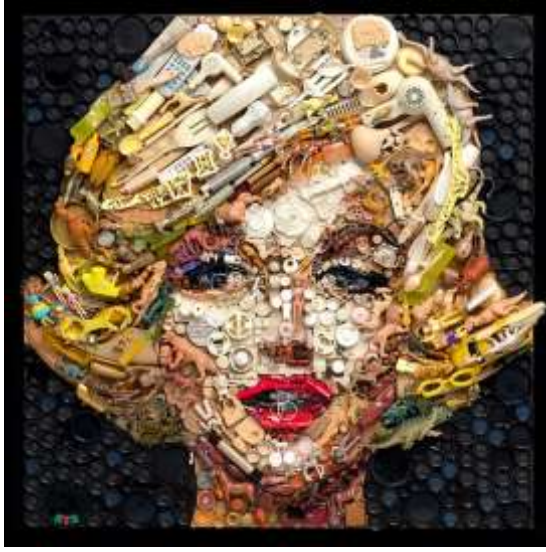
شكل رقم ( 14 ) . مارلين . عمل فني قوامه التوليف من البلاستيك ، واغطية الزجاجات ولعب الأطفال ، والأزرار

الأطفال ، والأزرار . ويعتمد على تحقيق الوحدة بالتداخل بين عناصر العمل الفني بالتكرار والتنوع .