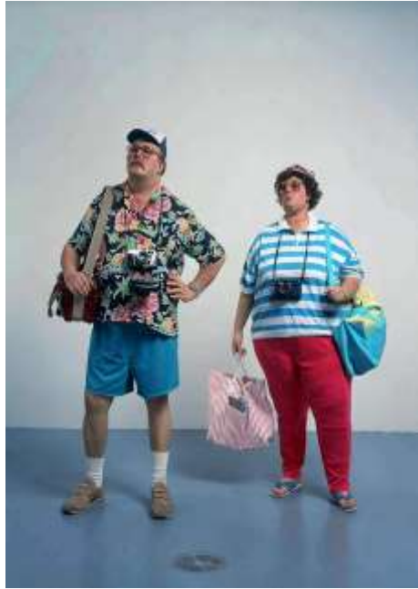
ديوان هانسون: شكل رقم ( 6 )، سانحين . 1988 ( توليف من خامات ومواد متعددة ومتعددة الألوان ، وسائط ممزوجة راتنج البوليستر والألياف الزجاجية ، ملابس، شنط , كاميرات , احذية )

• حاولت الباحثة فى الطرح السابق ان تضع نماذج متعددة من الاعمال الفنية التى تقوم على التوليف فى التصوير والنحت والاشغال الفنية والتركيب والتجميع لتوضح دور التوليف فى الفن المعاصر , ومدى اثره الذى تغلغل فى شتى مجالات الفنون التشكيلية , فان الاعمال السابقة من شكل 1 الى شكل 6 تؤكد على التالى :