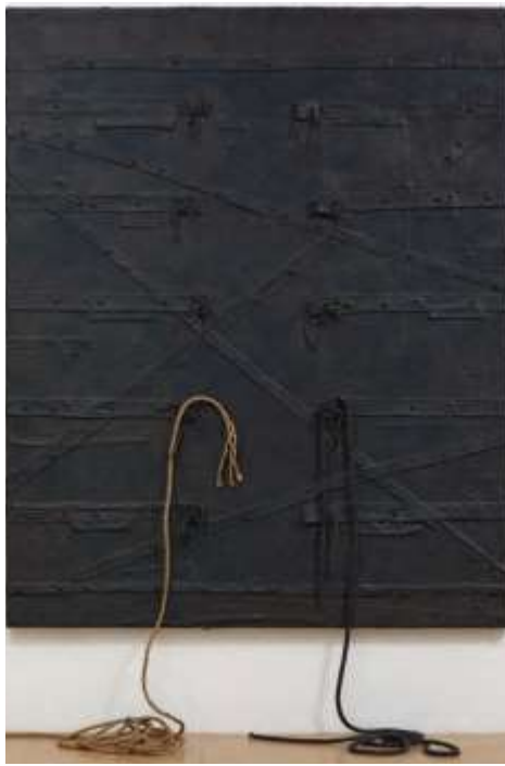
هارموندى هاموند: شكل رقم ( 2 ) احادية اللون . 2013م ( توليف من خامات الحبال والجلد ووسائط اخرى )

التوليف لخامات تتناسب مع بعضها البعض، حيث