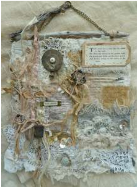
شكل رقم (13). القمر. اقمشة متنوعة , واحبال و خيوط , ازرار , خيش , خشب , معدن , جلد , شاش

● ولما كانت الاشغال الفنية المعاصرة تعتمد على التوليف فى الترابط والتشابك والتداخل بين عناصر العمل