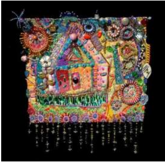
سوزان سوريل : العمل الرابع . شكل رقم ( 10 ) . الحقيقة الصعبة عن الأحلام. 2005 ( توليف من اقمشة – زجاج – بلاستيك – خرز - اسلاك – خيوط )