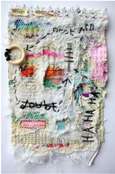
ايما باركر : العمل الاول . شكل رقم ( 7 ) الاسعافات . 2017 . ( توليف من اقمشة الكتان، الصوف، القطن- خيوط - شاش - ابر معدنية - خشب )