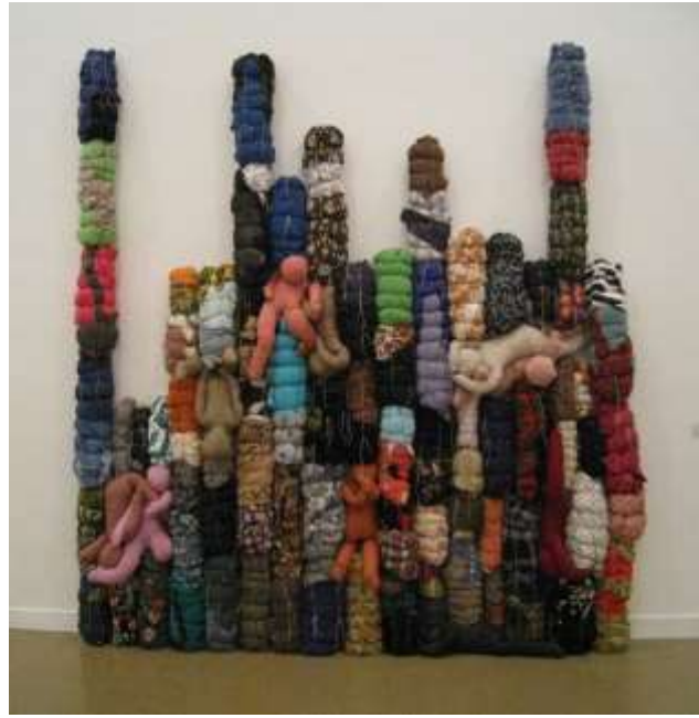
انيت مساجر : شكل رقم (5) بدون عنوان , 2000م ( توليف من أقمشة ، خيوط , فيبر )

▪ ان التوليف يُعد امتداد منطقي للتطور فى الفنون التشكيلية, لكونه حالة من البحث عن الحدائث بالمزج بين المواد والخامات , وتوحيدها فى وحدة فنية مترابطة , مع التأكيد على البساطة فى الشكل , والتجديد فى التقنية وصولا لابداعات فنية مستحدثة , وغير نمطية وذات مغزى تعبيرى .