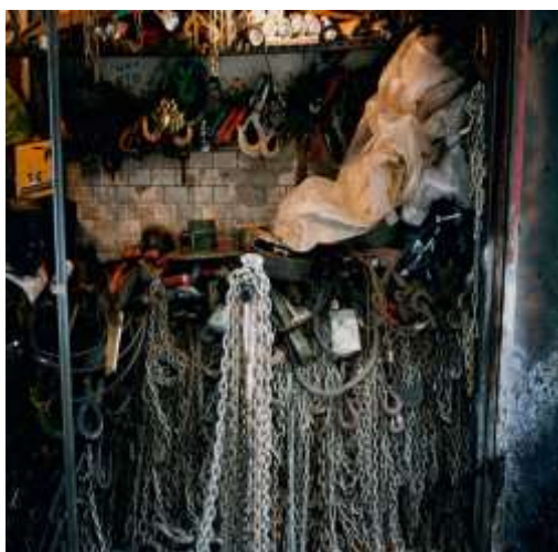
جيم دين : شكل رقم ( 4 ) . النوم فى النار، 2013 م (توليف من خامات متنوعة سلاسل , معادن متنوعة الاشكال , بلاستيك , حجارة )