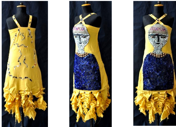
شكل (22) التصميم التاسع من الأمام والخلف والجنب

الحياسة للفستان، وتثبيت قطع الزجاج والمرايا المهمشة وأعواد الكبريت والقطع الخشبية على الفستان باللصق، وكشكشة الأشرطة في الذيل مع ترك أطرافها منسلة، وتم حشو طاقية الطفل بالفبير لتأخذ شكل بارز، إضافة أقمشة أخرى (خيامية) "Patchwork" ويظهر ذلك في شكل (23) .