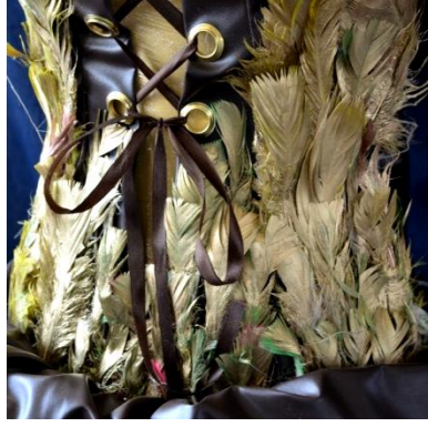
شكل (21) خامات التصميم الثامن