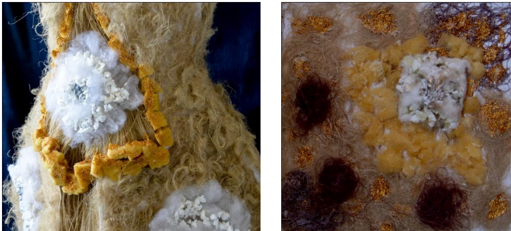
شكل (13) الخامات المستخدمة في التصميم الرابع