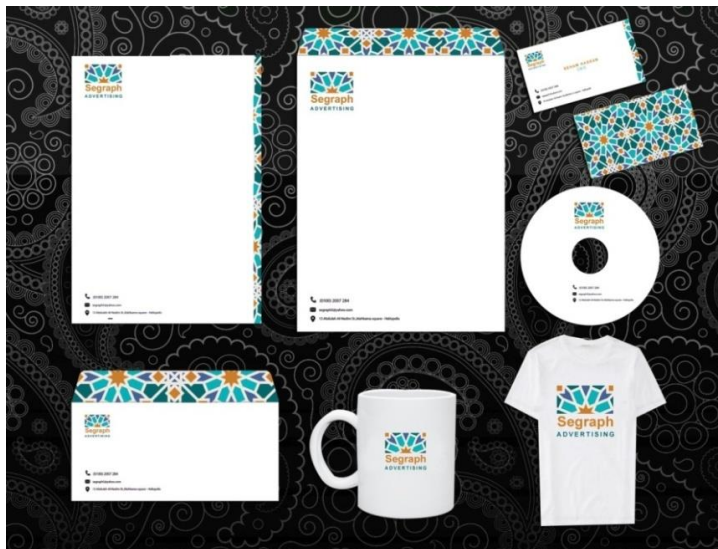
شكل ( 1 ) توضيحي للهوية البصرية من تصميم الباحثة

لذلك تلعب الهوية البصرية دوراً هاماً في مجالات التجارة والصناعة والإعلام في عصرنا الحالي وذلك حتى يستطيع كل منتج أو خدمة أن يتميز ويختلف عن أقرانه ومنافسيه على مستوى العالم خاصة في عصر المعلومات والتجارة الدولية الواسعة الإنتشار بين الجميع في مختلف وسائل الإعلام. ( Kathren Fishen : 2005 )