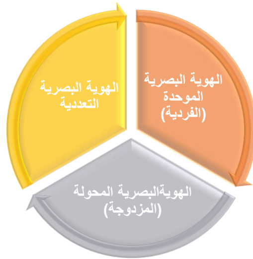
شكل ( 2 ) أنماط الهوية البصرية

ويمكن تقسيم أنماط الهوية البصرية كما في الشكل التالي إلى: