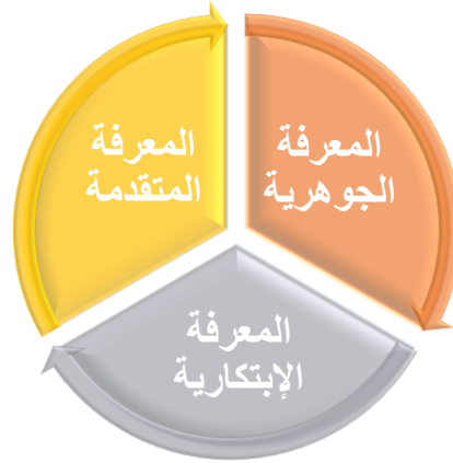
شكل ( 3 ) مستويات المعرفة البصرية