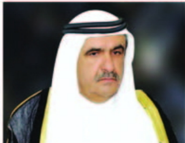
فهدية فداد العرش

كلمة المؤتمرات الدولية الأولى للحضارة العربية والفنون الإسلامية ومحافظة جنوب سيناء المصرية سمو الشيخ حمدان بن راشد آل مكتوم نائب حاكم دبي وزير المالية، راعي هذه الفعاليات الخيرية وحائزاً حمدان الطنينة، لقدراً لجهود سموه في توسيع المفهوم العالمي للحضارة العربية والفنون الإسلامية ودعم مسيرة البحث العلمي.